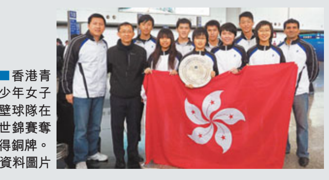
香港青少年女子壁球隊在世錦賽奪得銅牌。

港隊將於1日下午5時返抵本港，回港後將會加強哪方面的訓練，梁教練則指未有詳細計劃。