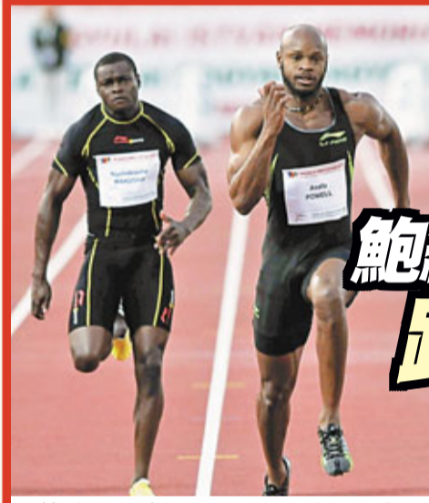
鮑維在布達佩斯以9秒86獲得百米冠軍，左為津巴布韋選手馬庫沙。