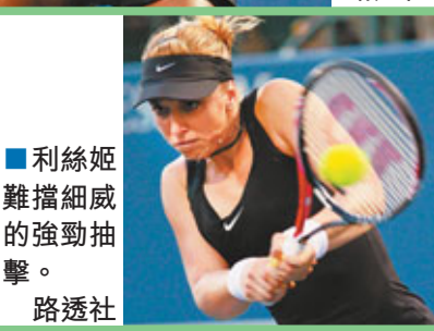
利絲妮難擋細威的強勁抽擊。