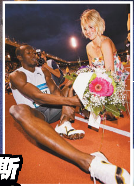
保特接受美女獻花。

6月30日，在2011年國際田徑鑽石聯賽瑞士洛桑站的比賽中，鮑維以9秒78的成績獲得男子100米冠軍，並創造今年世界最好成績。另一名牙買加名將、奧運冠軍甘寶一布朗在女子200米決賽中奪冠，她的成績是22秒26。來自近30個國家和地區的近200名選手參加了當天的匈牙利田徑大獎賽。 ■新華社