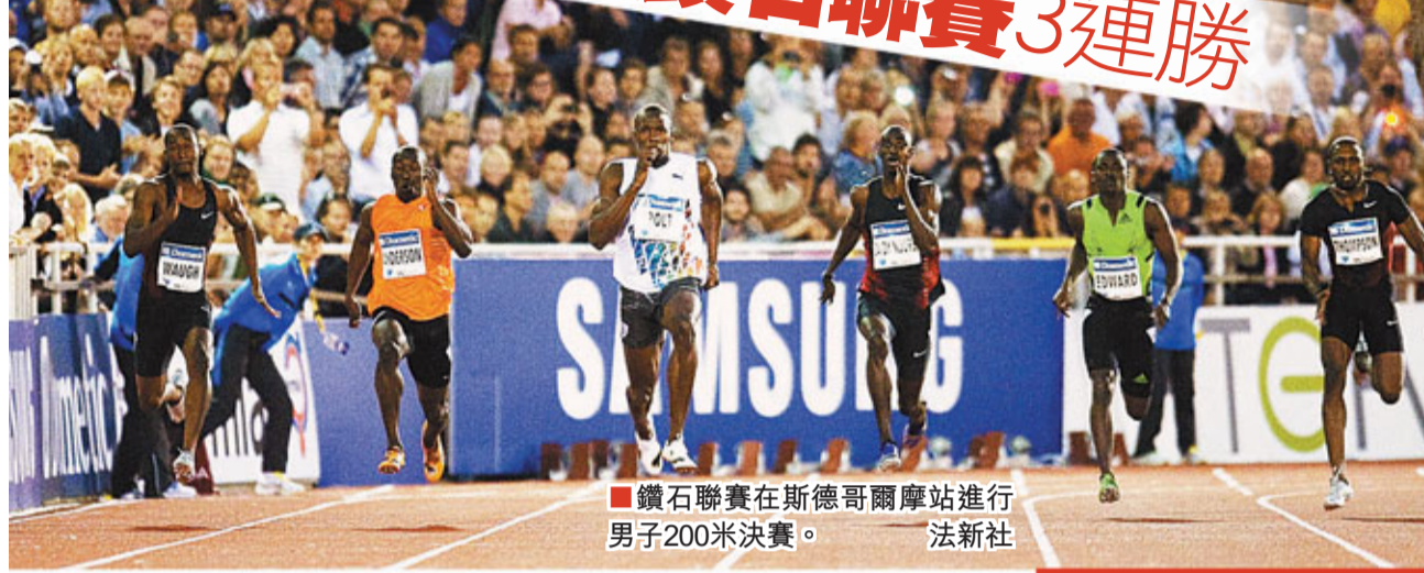
鑽石聯賽在斯德哥爾摩站進行男子200米決賽。

2011國際田徑聯合會鑽石聯賽進入第11站斯德哥爾摩站的爭奪。在瑞典斯德哥爾摩奧林匹克體育場進行的男子200米比賽，世界紀錄保持者牙買加閃電保特在未受到任何挑戰的情況下，輕鬆以20秒03的成績摘金，他在鑽石聯賽200米比賽中已經奪得3連冠。