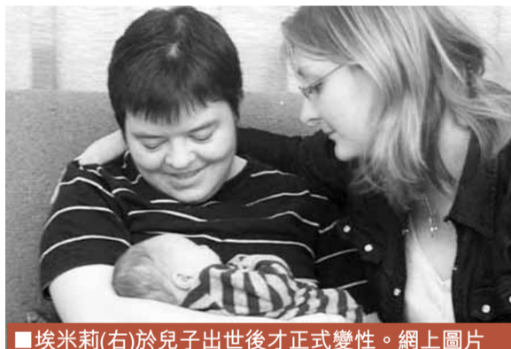
埃米莉(右)於兒子出世後才正式變性。