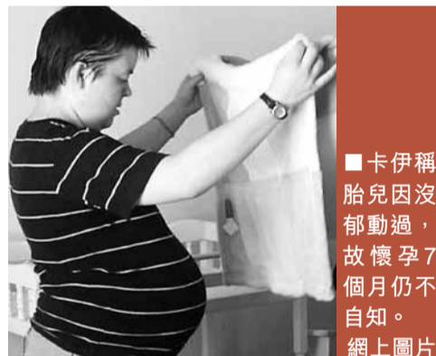
卡伊稱胎兒因沒郁動過，故懷孕7個月仍不自知。