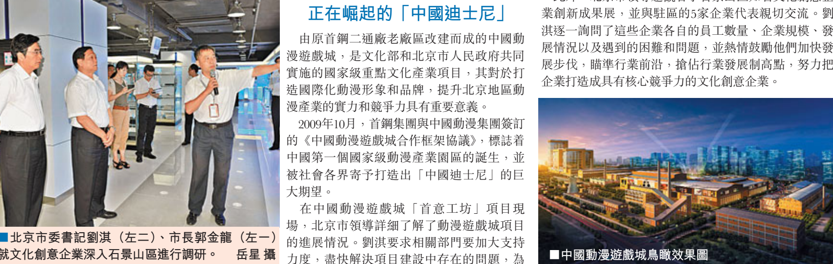
■北京市委書記劉淇（左二）、市長郭金龍（左一）就文化創意企業深入石景山區進行調研。

日前，北京市委書記劉淇、市長郭金龍深入石景山區文化創意企業和文化創意產業項目現場，就「大力發展文化創意產業，提升首都文化實力和競爭力」主題進行調研，北京市委常委李士祥、市委宣傳部部長魯煒等一同調研。劉淇強調，要加快文化創意產業集聚區建設，營造一流產業發展環境，瞄準行業前沿，加快發展步伐，打造一批具有核心競爭力的文化創意企業。 ■香港文匯報記者 張昕 近年來，石景山區抓住首鋼鋼產業搬遷和產業結構調整契機，重點發展文化創意和高新技術等產業，以數字娛樂為特色的文化創意產業取得了快速發展。目前已逐步形成以網絡遊戲、影視動漫、數字媒體為特色的產業發展體系，形成了北京數字娛樂產業示範基地和中國動漫遊戲兩大市級文化創意產業集聚區。 劉淇勉勵企業積極構建行業標準體系，保持先發優勢。 劉淇、郭金龍首先來到位於石景山區楊莊鼎城，從事音視頻產品及相關應用技術研發、製造、銷售的大型中央國有企業——中國華錄集團。據集團負責人介紹，該企業擁有世界先進的音視頻開發設計和生產能力，季頭產品藍光播放機佔據了全球同類產品市場的四分之一，並已形成國內最完整的高清數字光盤產業鏈，位居國內第一的互動遊戲及產業鏈和國內領先的智能交通軟件品牌。 對此，劉淇勉勵企業要積極參與構建行業標準體系，大力推廣自己成熟的技術標準，保持在行業中的先發優勢。隨後，劉淇還觀看了集團研發的教育化育系統演演示，並對該企業將專業技術推廣運用到學校教育中的做法表示讚賞。