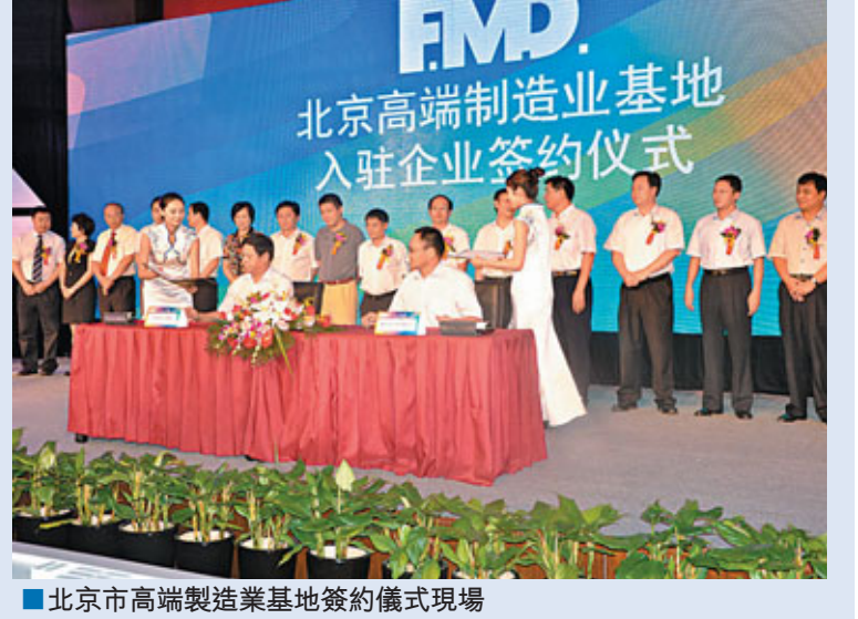
■北京市高端製造業基地簽約儀式現場

香港文匯報訊（記者 馬靜、鄭秋）北京市高端製造業產業基地日前正式落戶北京市房山區。北京市副市長肖文仲7月24日為該基地正式授牌。 北京市高端製造業基地位於房山實地鎮，基地規劃核心區為12平方公里，擴展區為30平方公里，控制區為50平方公里。專家認為，北京高端製造業基地的落成，有望成為中國首都經濟圈合理結構的有力支撐，促使其成為世界城市範圍內高端產業的標杆城市。從全國製造業格局看，基地也將為以北京為核心的環渤海經濟圈注入新動力，與珠三角的傳統製造業、長三角的現代製造業並列，成為中國製造業的第三極。該基地吸引的進駐企業將以「高科技高產值、低污染低排放、帶有研發性質高競爭