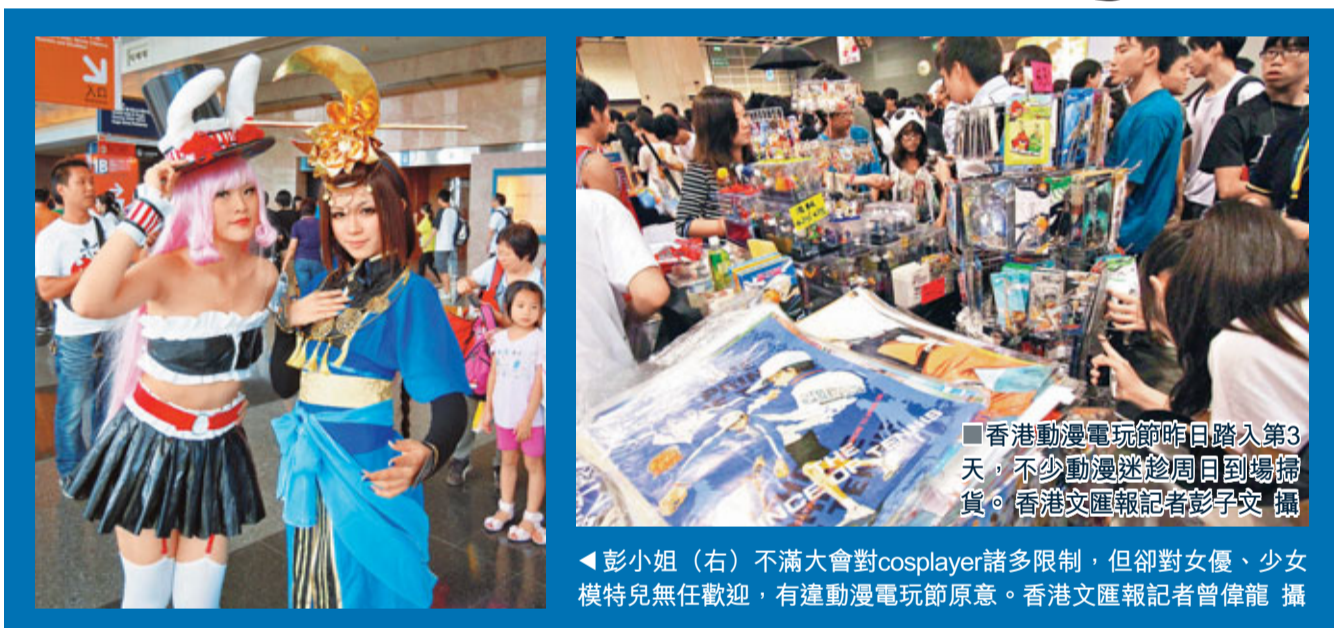
■香港動漫電玩節昨日踏入第3天，不少動漫迷趁周日到場掃貨。

彭小姐又不滿大會更衣室沒有間隔，cosplayer肉帛相見，故她沒有使用大會更衣室。她又投訴指，場內拍照區面積