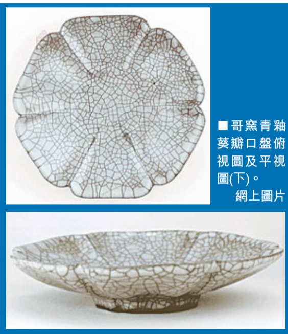
■哥窯青釉葵瓣口盤俯視圖及平視圖(下)。網上圖片

瓣口盤呈六瓣葵花式,淺腹,坦底。是宋代哥窯瓷器的代表作品。高4.1厘米,口徑20.2厘米,足徑7.5厘米,腹壁向裡凸出6道稜線,圈足亦隨腹壁起伏變化。通體施青灰色釉,釉面開細碎片紋。圈足露胎處呈黑褐色,此盤造型優雅、大方,線條富於變化,為宋代哥窯的代表作品。