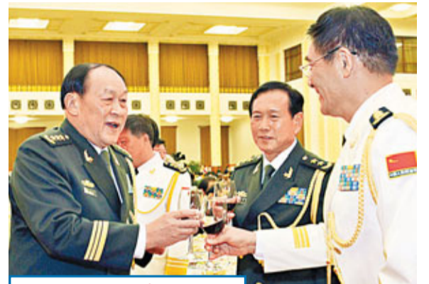
國防部招待會慶建軍 中國國防部昨日在北京人民大會堂舉行盛大招待會,慶祝解放軍建軍84周年。國務委員兼國防部長梁光烈上將向中外來賓致祝酒辭。

瓣口盤呈六瓣葵花式,淺腹,坦底。是宋代哥窯瓷器的代表作品。高4.1厘米,口徑20.2厘米,足徑7.5厘米,腹壁向裡凸出6道稜線,圈足亦隨腹壁起伏變化。通體施青灰色釉,釉面開細碎片紋。圈足露胎處呈黑褐色,此盤造型優雅、大方,線條富於變化,為宋代哥窯的代表作品。