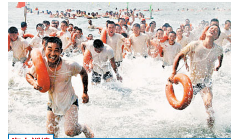
海上訓練 駐紮在上海市的「南京路上好八連」部隊千名士兵進行海上訓練。圖為完成了5公里泅渡訓練的士兵們衝上岸邊。