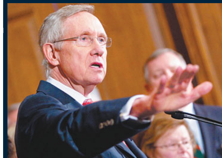
■民主黨參議院領袖里德表示，將提高債務上限法案的表決時間押後至本港時間凌晨，以便各方尋求共識。