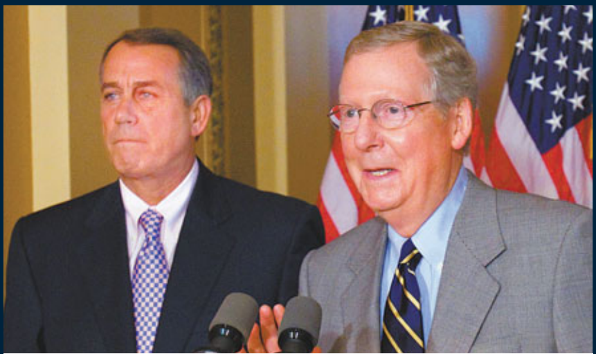
■參議院共和黨領袖麥康奈爾(右)與博納出席記者會，他表示兩黨談判「非常接近」共識。