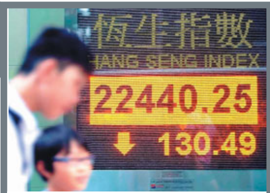
■恒生指數29日收報22440點，跌130點。

上周五美國道瓊斯指數收市下跌96點至12,143點，但港股在美國掛牌的預託證券股價則變動不大，其中匯控較香港收市價微跌0.48%至折合76.18港元，中移動(0941)則微升0.16%至折合77.68港元。