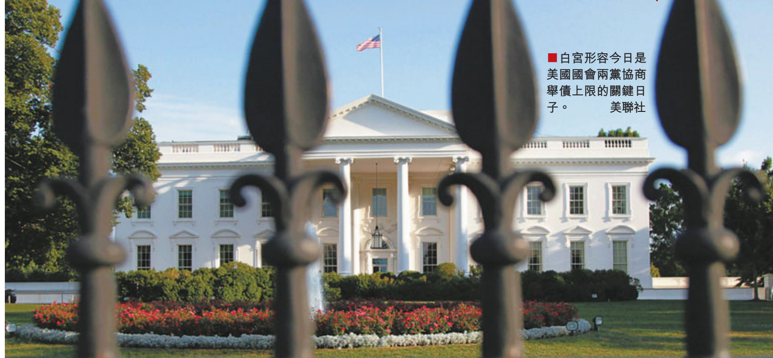
■白宮形容今日是美國國會兩黨協商舉債上限的關鍵日子。

明天就是美國債務上限談判的死線，在此前夕，據報談判各方終於在前晚深夜取得突破。據稱白宮和民主共和兩黨國會領袖，正商討一項分兩階段提高債限和削赤的「最終方案」，以應付直至明年年底的發債需求，不過媒體報道方案的金額眾說紛紜。參議院共和黨領袖麥康奈爾昨日則說，方案削赤規模將達3萬億美元(約23.4萬億港元)，而且「非常接近」共識。