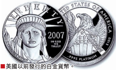
■美國以前發行的白金貨幣。

更重要的是，和引用第14修正案相比，這個方案帶來的憲法危機較小，財政部更可行下令在兩枚