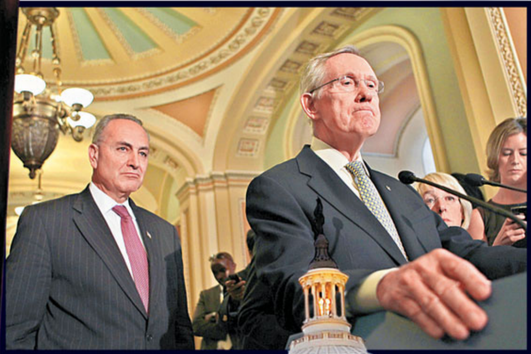
參院民主黨領袖里德(見圖)的方案已向共和黨讓步。