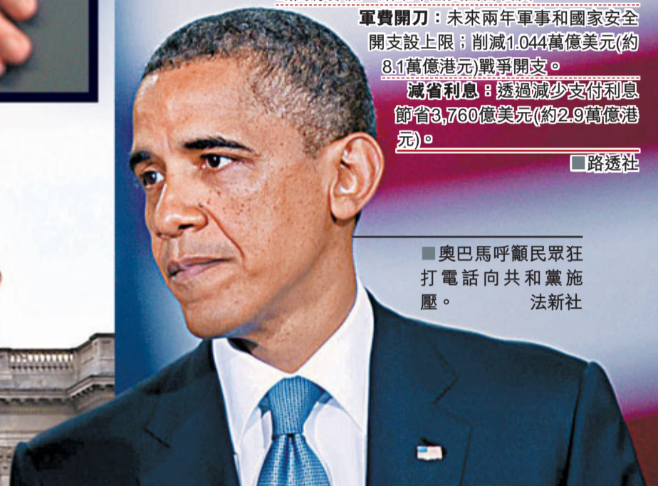
奧巴馬呼籲民眾狂打電話向共和黨施壓。

美國債務上限「死線」後日到期，共和黨籍眾議院議長博納的兩階段提限方案，前晚終在眾院過關，但一如所料遭參院否決。參議院多數黨領袖里德隨即提出折衷方案，呼籲共和黨接納。里德案將於當地時間今日凌晨1時(香港時間今日下午1時)，在參院作程序性投票，若獲足夠支持，便於明早最終表決。美國能否避過債務違約，繫此一線。