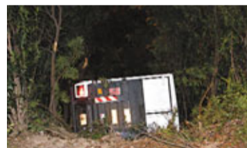
■重型密斗貨車在大嶼山觀景路國泰城對開失事, 衝落2米深斜坡叢林。

有熱帶氣旋信號。天文台預測今日大致多雲, 間中有驟雨及一兩陣狂風雷暴, 氣溫介乎攝氏28至31度, 及至下周五部分時間有陽光及有一兩陣驟雨。