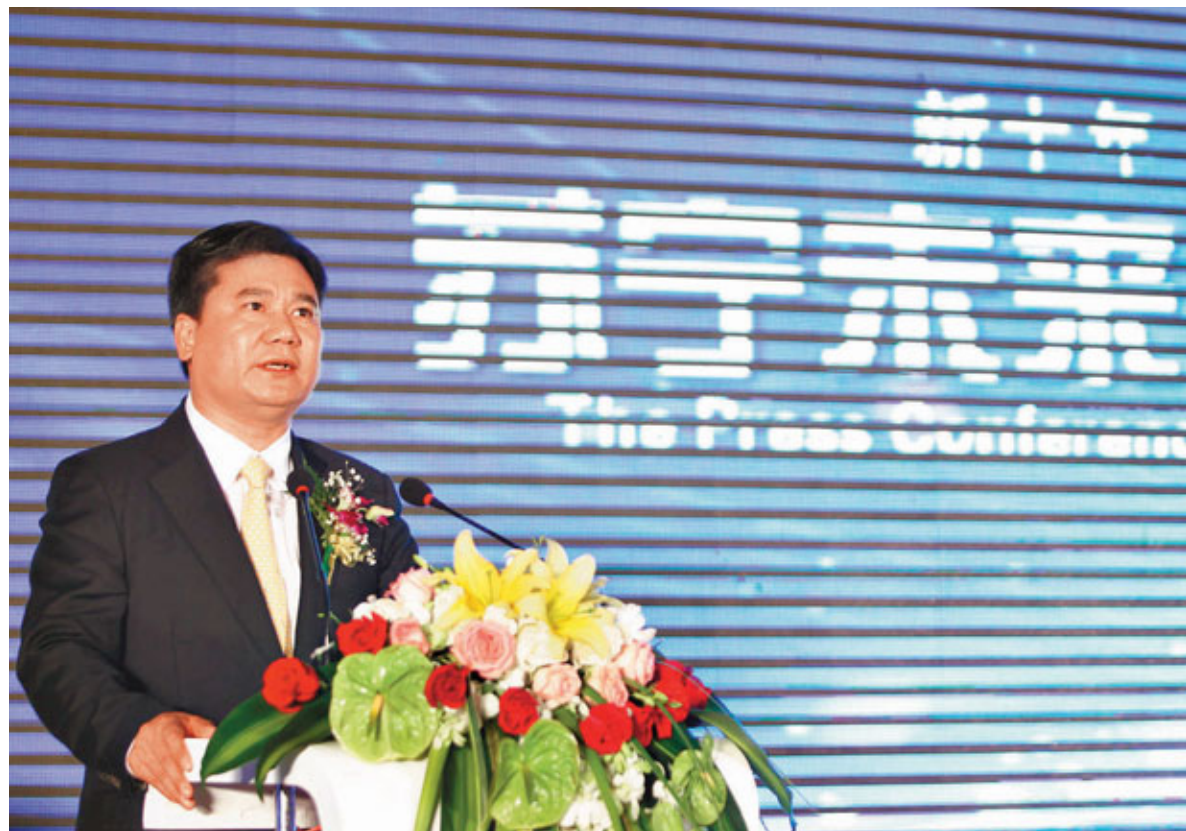
蘇寧電器董事長張近東表示,公司未來十年的目標為比肩全球一流企業。

至2006年,蘇寧盈利能力成功超越國美,國美公佈全年淨利潤為6.83億元,而蘇寧當年淨利潤經已達到