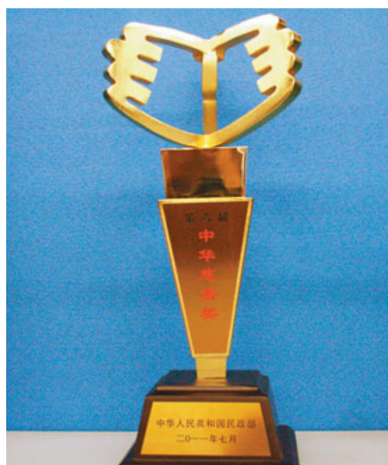
蘇寧獲得「中華慈善獎」。

香港文匯報訊(記者 軼璋 北京報道)2010年「中華慈善獎」評選結果日前在北京揭曉,蘇寧電器(簡稱蘇寧)獲得「最具愛心內資企業」獎項,為繼2008年後再次獲此殊榮,亦是內地家電零售行業唯一獲獎代表。中共中央政治局委員、國務院副總理回良玉,全國人大常委會副委員長華建敏及民政部領導出席會議並頒獎。