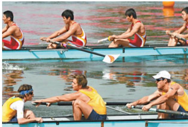
2010年國際名校賽艇艇賽，盛況空前。 香港文匯報 成都傳真

香港文匯報訊（記者 梁啟剛）中國網壇新生力量的代表人物張帥27日在比賽中因發燒感覺不適，不得不遺憾地中途放棄華盛頓女子網球公開賽。至此，參加本次總獎金為22萬美元賽事的兩位中國「金花」均「過早」終止了前進步伐；其中，鄭潔首輪在烈日下「暈乎乎」地告負，而張帥26日晚帶病堅持作戰，直落兩盤淘汰了本次賽會4號種子、澳洲名將杜基，爆出目前賽會最大冷門，但在27日比賽中退賽。