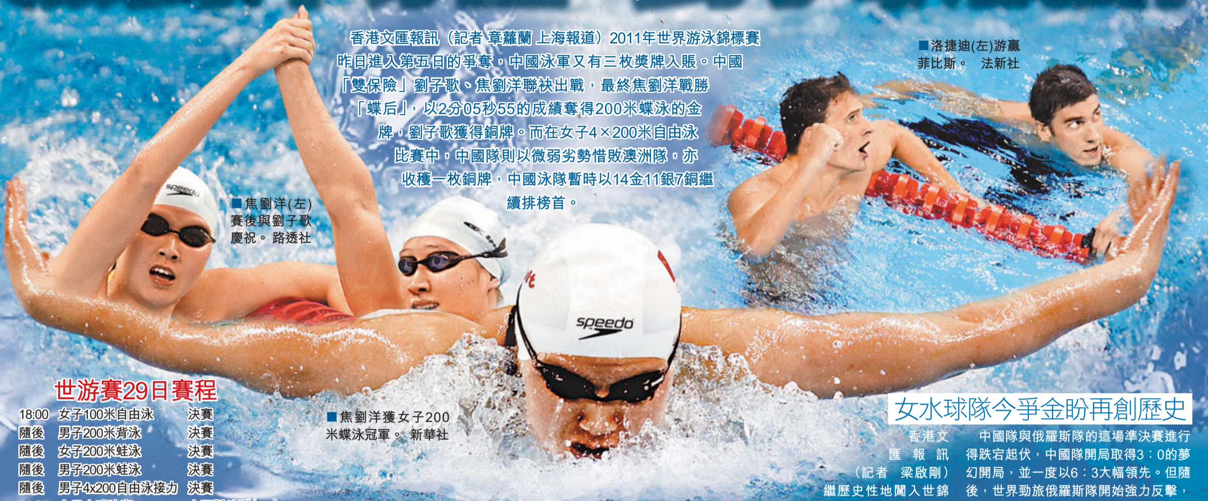
焦劉洋獲女子200米蝶泳冠軍。