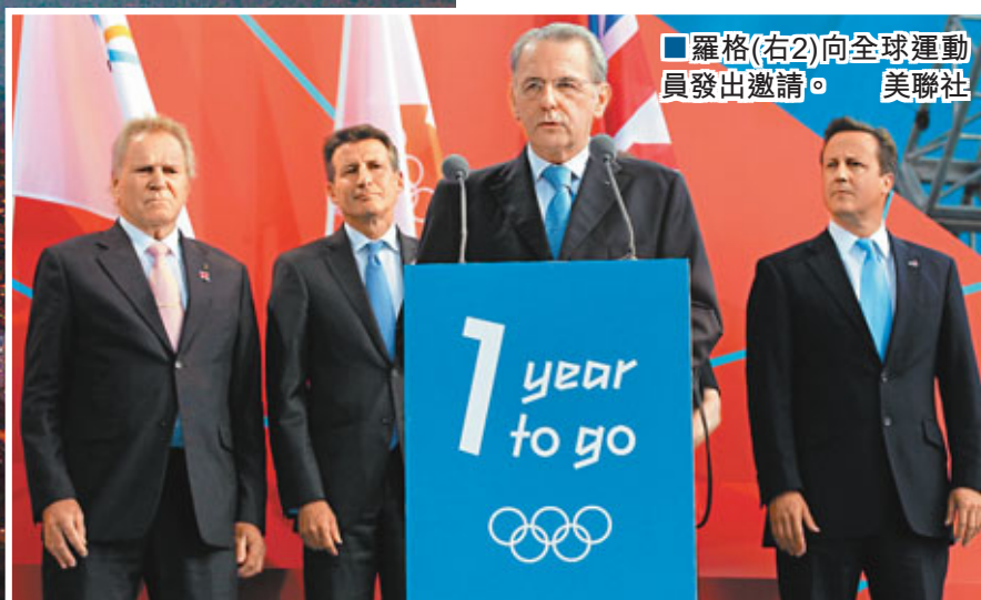
■羅格(右2)向全球運動員發出邀請。

據新華社27日體育專電 在倫敦奧運會迎來開幕倒計時1周年之際，國際奧委會會長羅格27日向全球運動員發出邀請，歡迎他們到倫敦參加2012年奧運會，並大讚倫敦奧運會的籌備水準，與08年北京奧運及00年悉尼奧運不相上下。羅格向倫敦說：「我只是有一個時鐘，告訴我明年7月27日晚上8時，你們必須已經做好準備。」