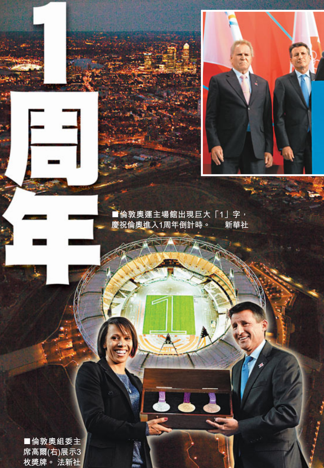
■倫敦奧運主場館出現巨大「1」字，慶祝倫敦進入1周年倒計時。新華社