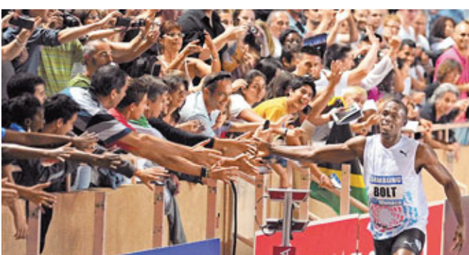
■保特(右)深受歡迎，難怪賽會願意支付高昂出場費。資料圖片

除了個人出場費，斯德哥爾摩站選為選手準備豐厚獎品，打破賽事紀錄的運動員將得到一枚重1卡、價值1萬美元的鑽石。在男子200米跑比賽中，保特的主要對手是來自巴拿馬的愛德華及挪威名將杜爾，這2名選手之前都曾跑進20秒大關。