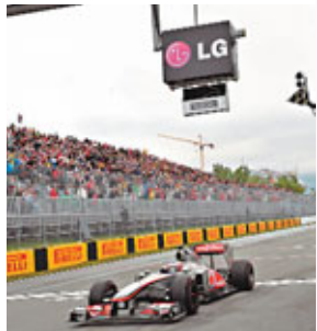
■畢頓已在F1打滾11個賽季。資料圖片