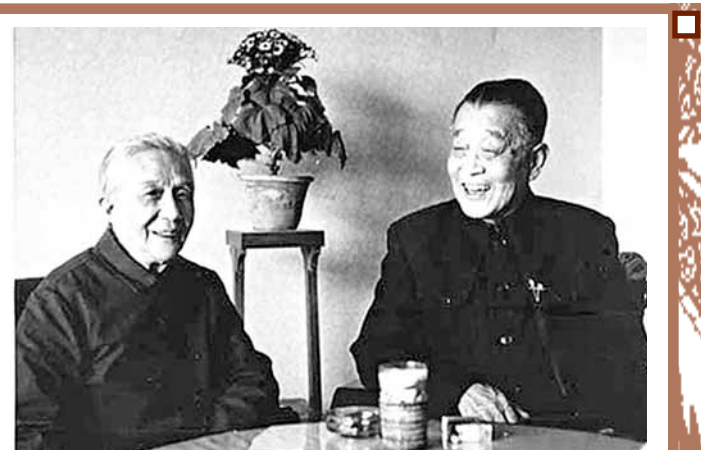
杜聿明與曹秀清夫婦。