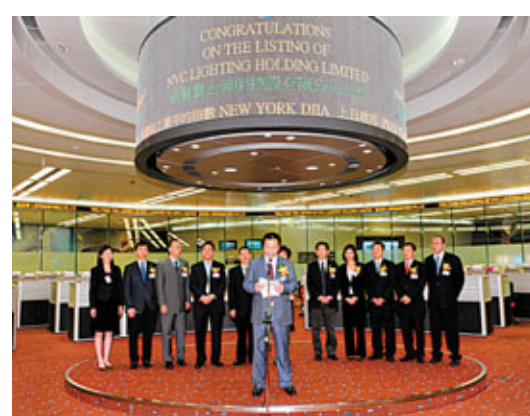
雷士照明於2010年5月20日在香港聯交所上市

瞄準「世界品牌」，成為受人尊敬的全球性公司，一直是雷士的奮鬥目標。為此，雷士於2006年成立海外營銷事業部，開始了海外市場的開拓之路。