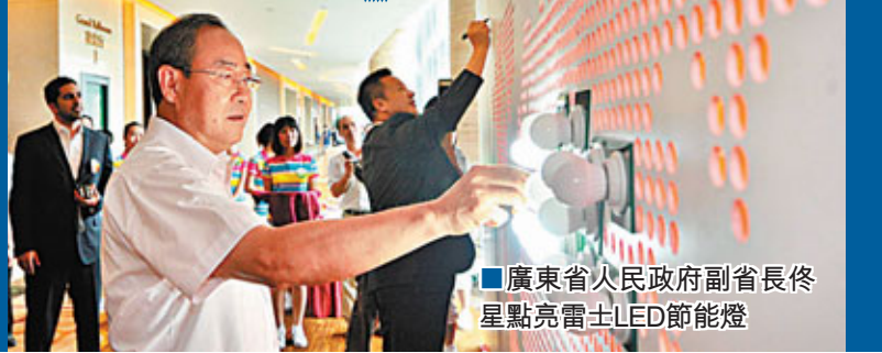
廣東省人民政府副省長佟星點亮雷士LED節能燈

近年來，發展迅猛的雷士照明被業界譽為「雷士速度」。雷士總裁吳長江表示，此次與亞奧理事會的合作，是雷士照明發展史上繼開辦國際資本運作、中標北京奧運會照明工程、成功在香港上市之後，又一個具里程碑意義的大事件，對雷士的國際化進程具跨越性推動意義。