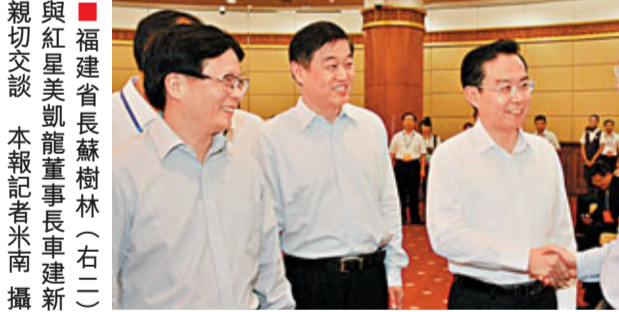
與紅星美凱龍董事長車建新親切交談