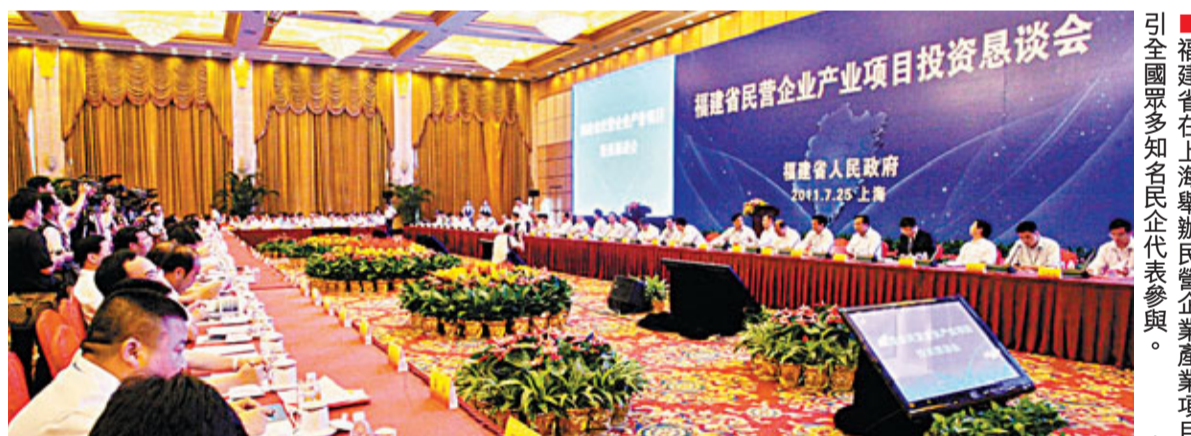
責任編輯：林潔瑜 版面設計：劉坻坻