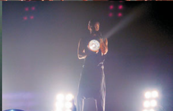
謝勒滿場飛外，還拿着大光燈照歌迷。