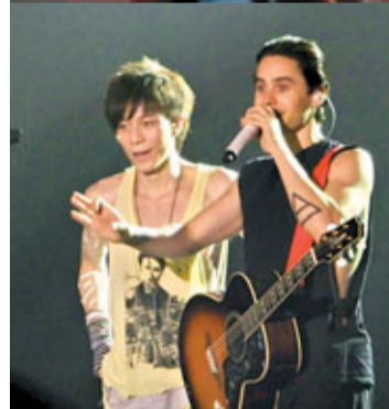
男歌迷教主音謝勒講粗口，惹人發笑。