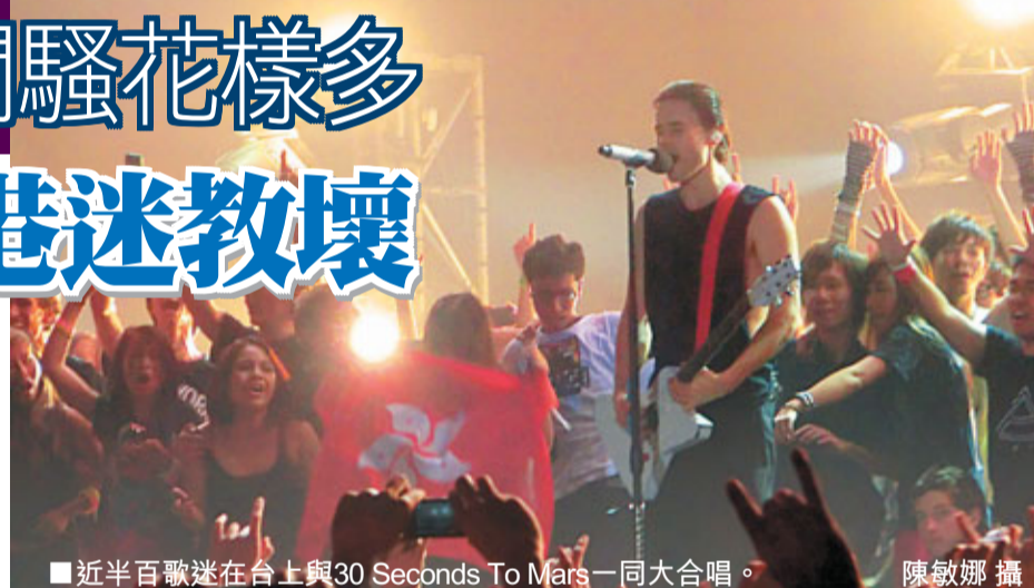
近半百歌迷在台上與30 Seconds To Mars一同大合唱。

安歌時，謝勒及工作人員請了近百歌迷上台，一同演唱《Kings And Queens》，有女歌迷帶同香港特區區旗上台，謝勒亦與他們一一握手。演唱會完畢後，鼓手Shannon把鼓棒拋到台下，引來歌迷爭奪。