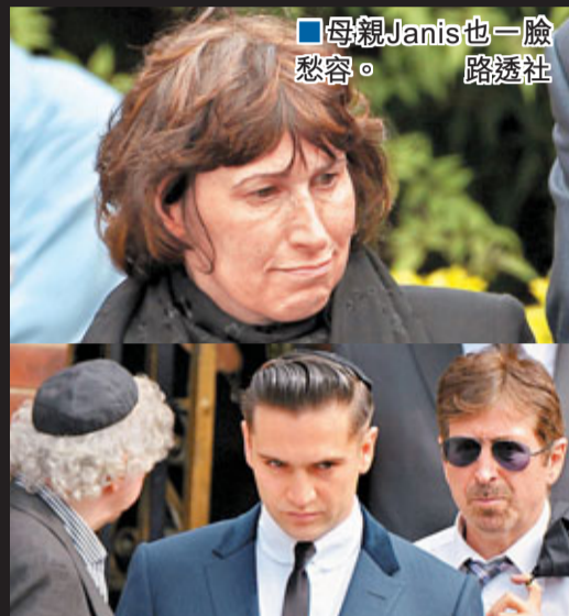
母親Janis也一臉愁容。