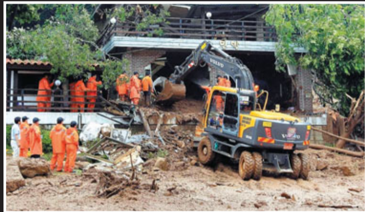
■山泥衝擊春川一間房屋，救援人員搜索生還者。