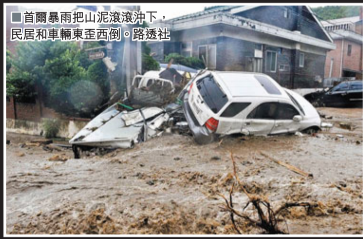
■首爾暴雨把山泥滾滾沖下，民居和車輛東歪西倒。