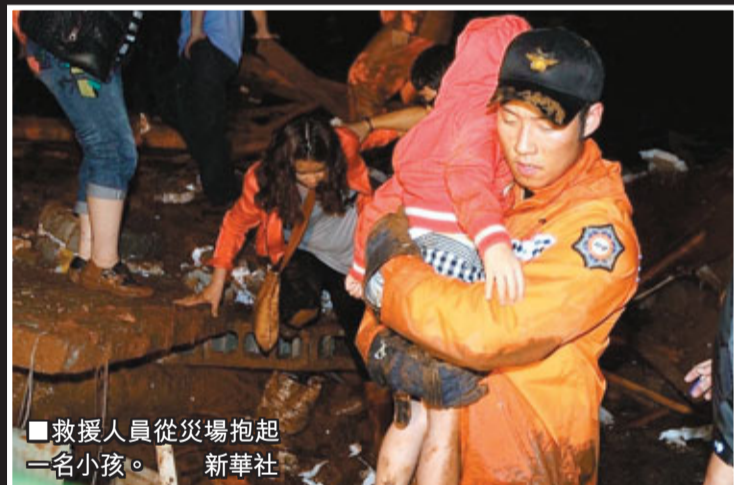
■救援人員從災場抱起一名小孩。