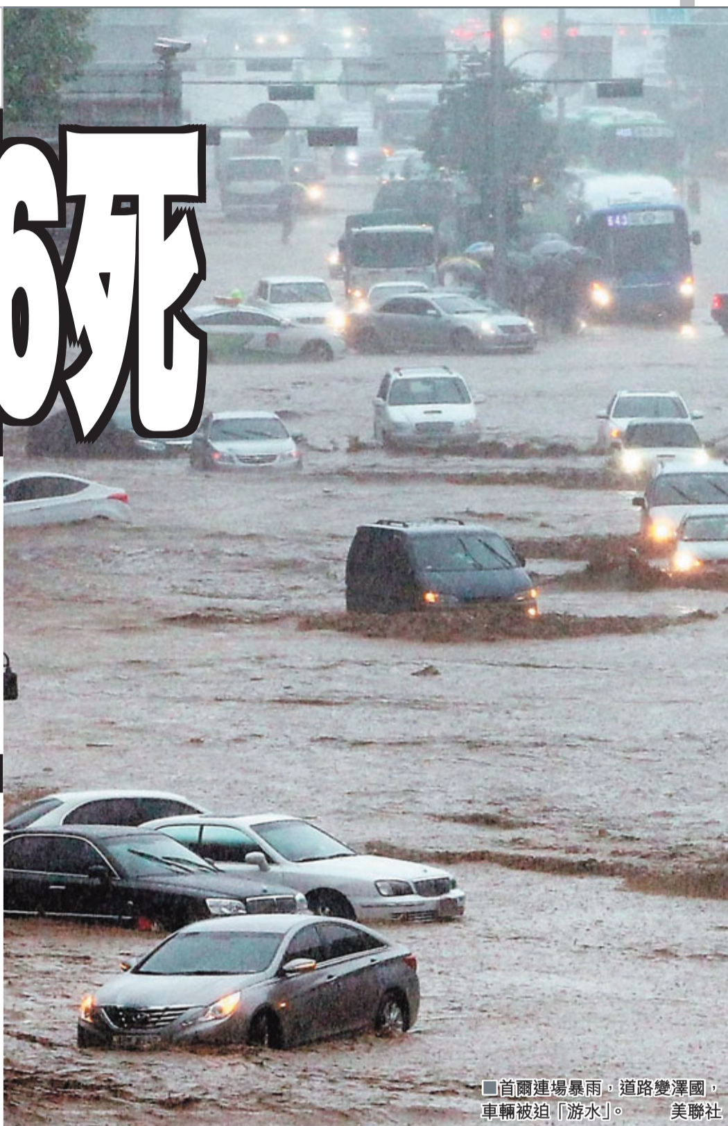
■首爾連場暴雨，道路變澤國，車輛被泡「游水」。