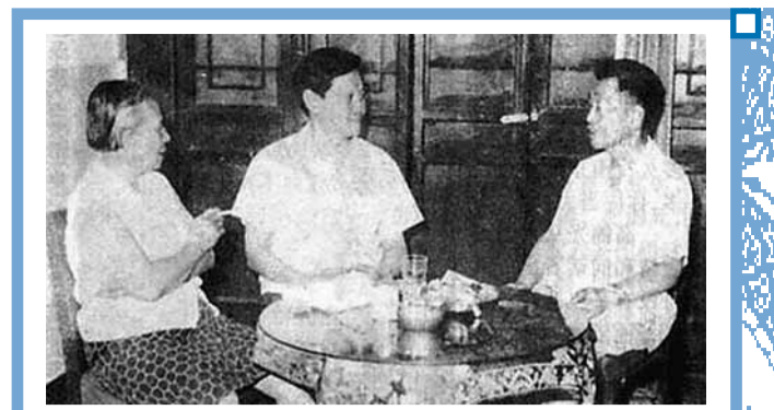
1972年，杜聿明夫婦與女婿楊振寧在北京會面。