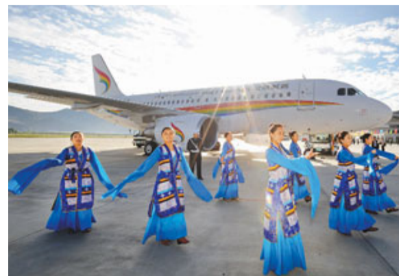
民眾在首航儀式上跳起藏族歌舞。

香港文匯報訊(記者 王濤 拉薩報道)7月26日上午10時26分,伴隨一架用四色彩虹和藏漢英三種文字標識機身的A319飛機從拉薩貢嘎機場騰空而起,備受外界關注的世界上首家以高原為基地的航空公司——西藏航空有限公司(簡稱「西藏航空」)正式開飛了其在中國航空市場的征途。