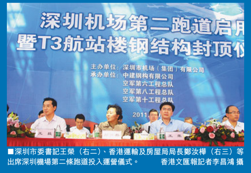
深圳市委書記王榮(右二)、香港運輸及房屋局局長鄭汝樺(右三)等出席深圳機場第二跑道投入運營儀式。