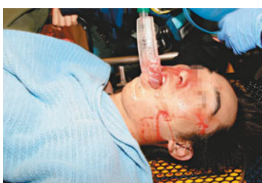
青年在西貢雙鹿石澗疑跳水遇溺，送院時已無氣息。香港文匯報記者溫瑞麟攝

香港文匯報訊(記者 溫瑞麟 杜法祖) 郊野溯洞活動危機重重，繼前日一名28歲青年於大埔橫涌石澗潭溺斃後，昨晨再有一名17歲獨子，與友人結伴於西貢雙鹿石澗鳴幽瀑跳潭消暑嬉戲期間，樂極生悲，頭部撞及潭石重創遇溺昏迷，由於現場無覆蓋手機網絡，友人需步行半小時報警求救，飛行服務隊直升機將事主送抵醫院證實不治，父母趕到醫院痛失愛兒悲慟欲絕。今次是15日內第3宗溯洞活動奪命意外。