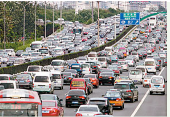
北京的交通堵塞情況嚴重。

寫到這裡，我不由想起了新西蘭人的駕車文化。在新西蘭，私家車入戶率高達90%，整個城市交通順暢、安全，交通事故率也很低。這不能不歸功於新西蘭人的禮讓規則：駕車者相互禮讓，人車衝突車禮讓在先。在新西蘭的大街上，你幾乎看不到交通警察，也沒有發現哪裡有隱藏的電子眼。再看瑞典、丹麥、法國、美國等發達國家，交