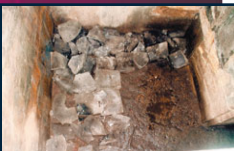
■梁王后墓中發現的中國最早的冰箱。