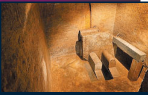
■廁間腳踏石上刻有精細的圖案。