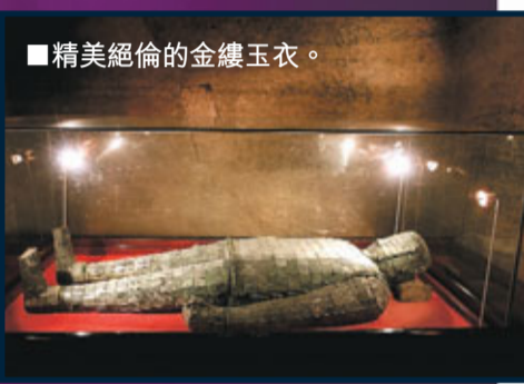
■精美絕倫的金縷玉衣。