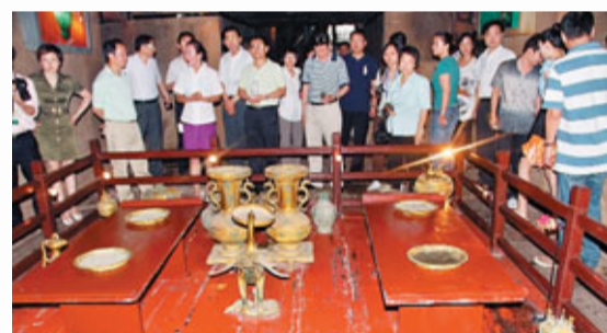
■文匯報記者一行參訪梁孝王陵墓。

距離王后墓200米處，坐落着梁孝王墓。導遊介紹稱，這屬於夫妻「同墳異穴」合葬的陵墓。但令記者感到疑惑的是，無論從規模還是結構，梁孝王墓都遠遜於王后墓。