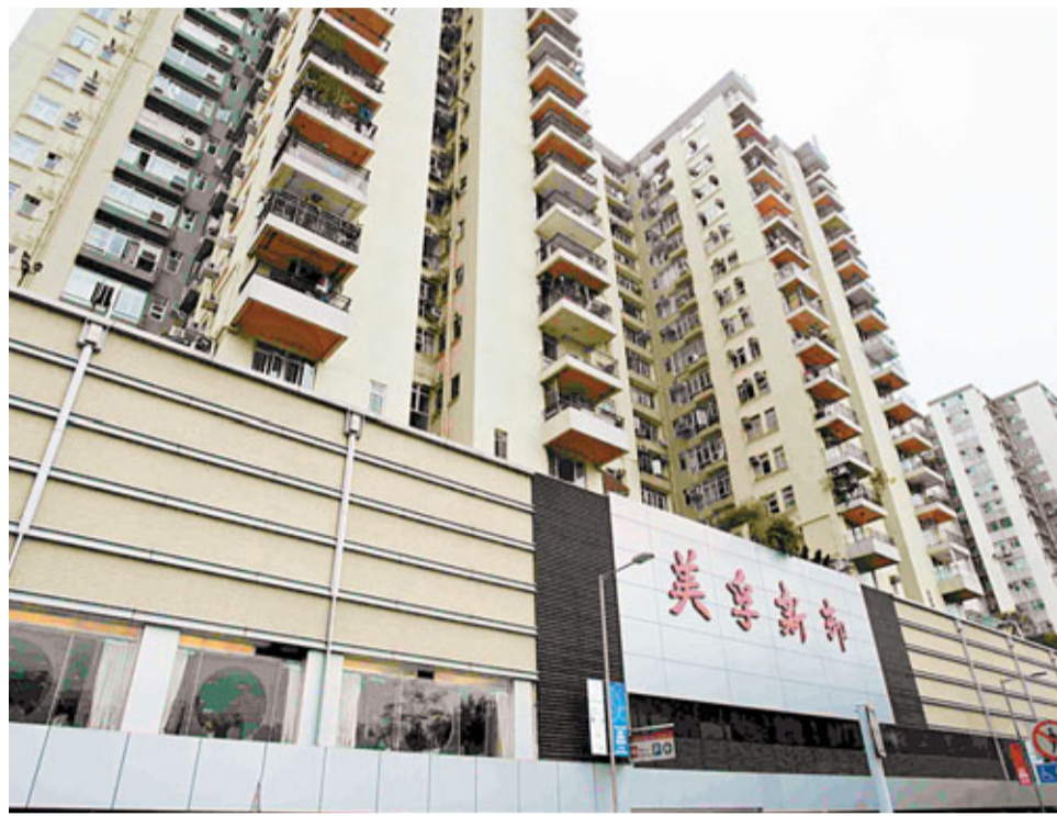
■荔枝角美孚新邨周末成交回升, 造價續跌。

分區方面, 中原港島區三個藍籌屋苑錄得4宗成交, 較前周多1宗, 其中太古城本月平均呎價