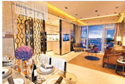
■瓏璽迎海鑽18樓B示範單位, 建築面積1,383平方呎。 資料圖片