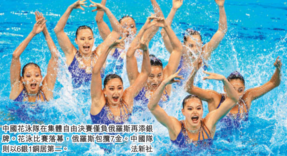
中國花泳隊在集體自由決賽僅負俄羅斯再添銀牌。花泳比賽落幕，俄羅斯包攬7金。中國隊則以6銀1銅居第三。