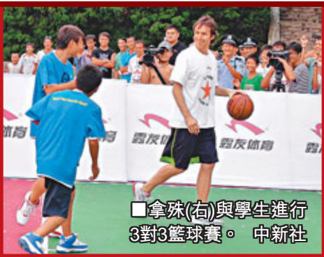
■拿珠(右)與學生進行3對3籃球賽。

2007年，拿珠基金會攜手姚明在中國舉辦了一場籃球義賽，為中國西部地區建造學校，共籌集200多萬美元善款。拿珠表示，今後會繼續關注中國西部兒童的成長。「與中國結緣起因為就是姚明。」提及好友姚明的退役，拿珠表示有些沮喪，「姚明是位非常偉大的球員，他改變了世界對中國籃球的看法，相信今後他會發展得很好。」 對於NBA即將面臨的賽季停擺，拿珠：「儘管有3個孩子需要照顧，這對我很難，但在各方面條件成熟的情況下我依然願意到中國打球。」