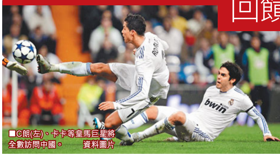
■C朗(左)、卡卡等皇馬巨星將全數訪問中國。 資料圖片

據新華社廣州24日電 西班牙皇家馬德里24日公佈了來華參加熱身賽的26名球員名單，C朗拿度、卡卡、奧斯爾、賓施馬等球星領銜的皇馬一線隊幾乎全部主力球員都出現在名單內，還包括五名今夏新簽約的球員。 據了解，皇馬此次來華的全體成員定於31日下午乘坐包機從英國抵達廣州，正式拉開2011皇馬中國友誼賽的序幕。 2011皇馬中國友誼賽共分為兩站，分別是8月3日晚在廣州天河體育中心體育場對陣廣州