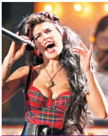
■Amy的星光之路曾一片光明，可惜卻染上毒癮。

曾奪五項格林美大獎，被視為英國10年來最被看好的新人Amy Winehouse，就這樣撒手人寰，不禁令人仰天長嘆。她在1983年的9月14日出生，13歲時得到了她人生第一把結他，一年後開始創作歌曲；16歲時被Tyler James發掘，其於2003年發行了首張專輯《Frank》。不過其音樂事業的大成功可謂是於2006年10月的第二張專輯《Back to Black》。她更在第50屆格林美頒獎禮中勇奪5獎，包括年度細碟、年度歌曲、年度新人、流行樂大碟和最佳流行女歌手，同時也使她成為了有史以來第一位於一屆內贏得五座格林美獎的英國歌手。儘管事業上非常成功，但她卻因吸毒、酗酒等行為頻頻見報，雖然曾經接受治療，但仍未能戒除陋習。她於上月在歐洲開騷時就因為帶醉演出，令現場樂迷噁聲不絕，亦令她要取消行程。此外，她的蜂巢髮型也成為其個人標誌。