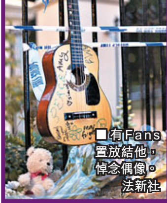
■有Fans置放結他，悼念偶像。