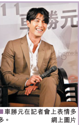
■車勝元在記者會上表情多多。

韓國性格男演員車勝元和組合SS501成員金亨俊前日分別赴台，出席昨晚舉行的粉絲見面會。雖然車勝元比金亨俊大18歲，堪稱中坑花美男，卻比對方更受台灣妹歡迎，吸引300多名粉絲接機，他在機場鞠躬感謝影迷支持，及後在記者會又大晒中文，認真誠實。