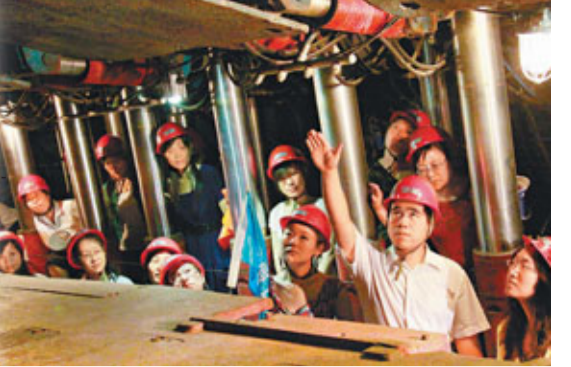
■在千米井下，導遊向遊客講解煤炭開採情況。