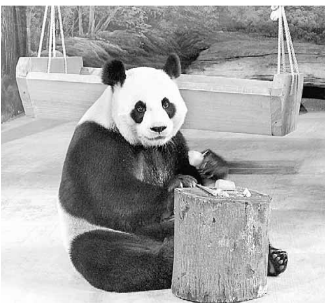
圓圓一度傳出懷孕,最後專家證實是「空歡喜」一場。資料圖片

至於明年團圓圓圓的繁殖狀況,趙明傑說,由於團圓圓圓今年都是6歲半,團圓是第一次發情,明年會越成熟,與圓圓交配繁殖成功的機率會更高。動物園也會看狀況,明年等團圓圓圓發情期時,再幫牠們進行人工受精。