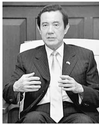
馬英九接受日本傳媒專訪,提及到兩岸關係及2012大選選情。

日媒報道指出,馬英九於2009年處理88風災水患不力,無法消除台灣民眾對當局的不安;但目前他的民意支持率與將角逐「大選」的民進黨主席蔡英文的差距不大。馬英九的王牌是「對大陸關係處理能力」,馬英九上台以來,與大陸簽署了兩岸經濟合作框架協議(ECFA)等15項協定,他在兩岸經濟關係深化及關係緩和的功績備受肯定。台灣的官方民調(5月份)顯示,過半數台灣民眾肯定兩岸關係改善。