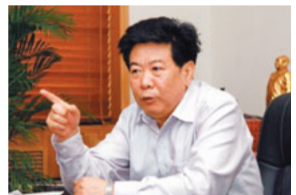
■石家莊市市長艾文禮表示，過去五年是石家莊市容變化最大，城鎮化水平提升最快的五年。

在這之前，石家莊曾被列為全國污染最為嚴重的省會城市之一。那時候，石家莊的天總是灰的。而今，49家重點污