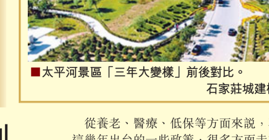
從養老、醫療、低保等方面來說，石家莊這幾年出的一些政策，很多方面走在了全國的前列。三年時間裡，石家莊的環境質量、承載能力、綜合實力以及人民群眾的歸屬感、自豪感和幸福感快速提升。目前該市迎來「三年上水平」第一年，全市正全力打造繁華舒適宜居的一流省會城市，未來三年，這座年輕的省會城市還會成長到什麼高度，我們拭目以待。