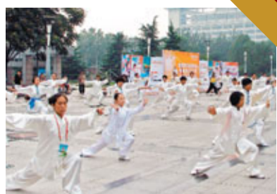
■石家莊是一座令市民舒心、安心、放心，也充滿信心的城市。圖為市民在打太極拳。資料圖片