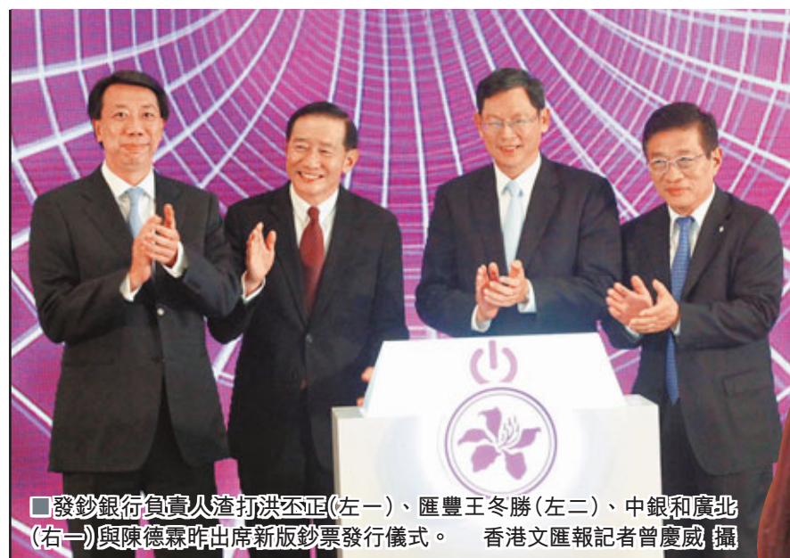
發鈔銀行負責人渣打洪丕正(左一)、匯豐王冬勝(左二)、中銀和廣北(右一)與陳德霖昨出席新版鈔票發行儀式。