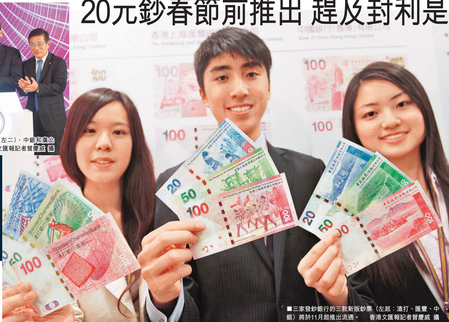
三家發鈔銀行的三款新版鈔票(左起：渣打、匯豐、中銀)將於11月起推出流通。

香港文匯報訊(記者 馬子豪)市民明年將有新設計的銀紙封利是。繼1,000元及500元後，金管局昨公布全新設計的2010版港幣新鈔票系列，餘下的100元、50元及20元新設計式樣。今年11月將率先推出100元及50元，而封利是「熱門鈔票」的20元，將趕及於明年1月初推出，並會預定足夠數量，方便市民封利是。