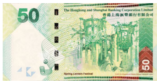
以元宵佳節作主題的匯豐50元新鈔，圖案附上燈謎。

除引入較先進的防偽特徵外，新鈔票亦繼續引入設有無障礙特徵，給予視障人士辨別鈔票，包括凹凸銀碼、手感線和點字。另外亦設有量鈔器，讓視障人士量度鈔票的長度，從而辨別鈔票銀碼，量鈔器將透過服務視障人士的志願機構，免費派發有需要人士。