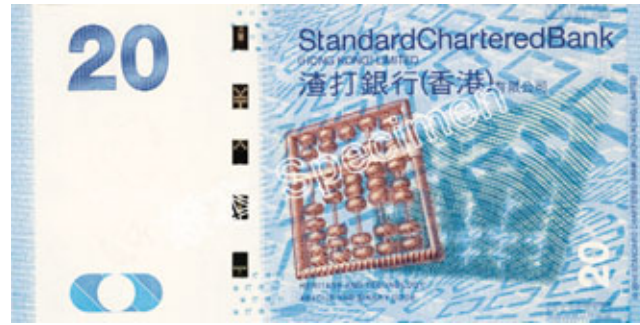
渣打20元新鈔的算盤以及電腦系統圖像，顯示計算機的演進。