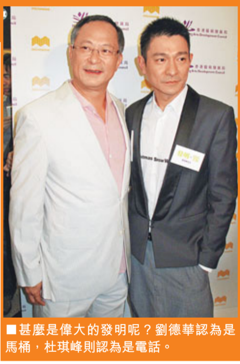
甚麼是偉大的發明呢？劉德華認為是馬桶，杜琪峰則認為是電話。

對於周刊的報道，華仔笑說：「不回應，周刊有她的說法，選擇看的人就看，我不計較真假。」講到周刊拍到他和朱麗倩以視像祈福，他希望這相可以帶動昨日的主題。問他日後會怕偷影而不再一起去佛寺？他說：「這是我生活的一部分，我不曾有這個想法，好啦，到此為止。」之後雙手合十，示意訪問結束。