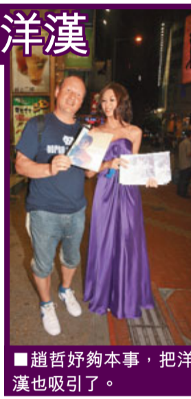
趙哲好夠本事，把洋漢也吸引了。

今年不少嘍模寫真意淫又露毛，相對之下Uni的寫真少了話題性，她說：「寫真雖然係走高貴注重藝術路線，但都會親民少少，自己行落街同大家接觸下。」Uni在港雖未被廣泛認識，但原來不少自由同胞卻認得她，紛紛要索取她的寫真。