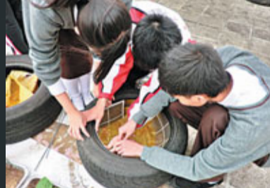
順德聯誼總會李兆基中學同學從修車店收集舊輪胎，製成環保花盆。