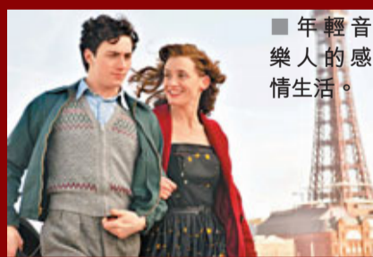
■ 年輕音樂人的感情生活。