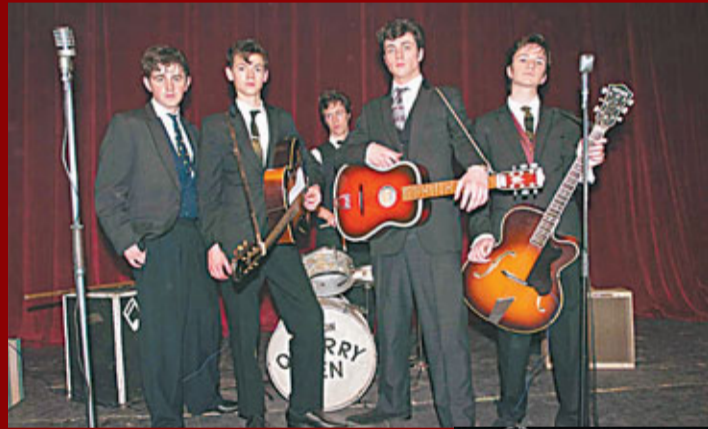
■ 述說了「前披頭四」時代的故事。

時也命也，這樣子便建立了他搖滾音樂史上的重要地位。1980年12月8日，一顆子彈卻完結了他的音樂傳奇。或許，死亡令他變得更傳奇，解放性、個人化的音樂思想，被高舉上「神枱級」地位。至今天，約翰還不斷被神化。而這部電影把能成功協助樂迷回到「地上」，察看約翰還在「人間」時候的作為。或許，要認識一種音樂，應該返回起點，從其源頭開始察驗。