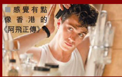
■ 感覺有點像香港的《阿飛正傳》。