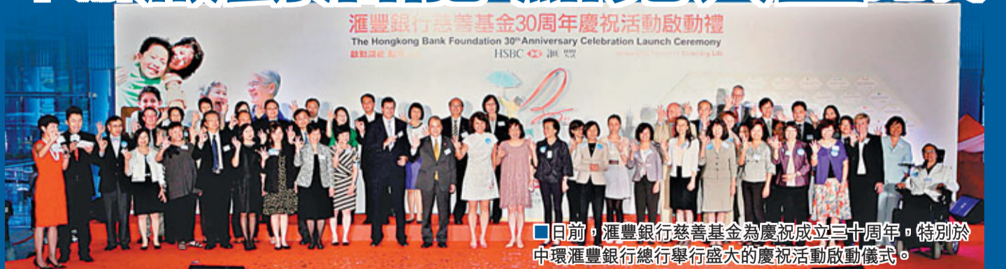
日前,滙豐銀行慈善基金為慶祝成立三十周年,特別於中環滙豐銀行總行舉行盛大的慶祝活動啟動儀式。

滙豐銀行慈善基金為慶祝成立三十周年,將舉行一系列以「啟動潛能 點亮人生」為主題的慶祝活動,讓各界人士共同參與。活動包括「我的理想社區」攝影及繪畫比賽、「社區達人」網上大挑戰、「啟動潛能 點亮人生」感人故事系列等,其中「我的理想社區」攝影及繪畫比賽的得獎作品,更有機會於「滙豐銀行慈善基金三十周年展覽」中展出。