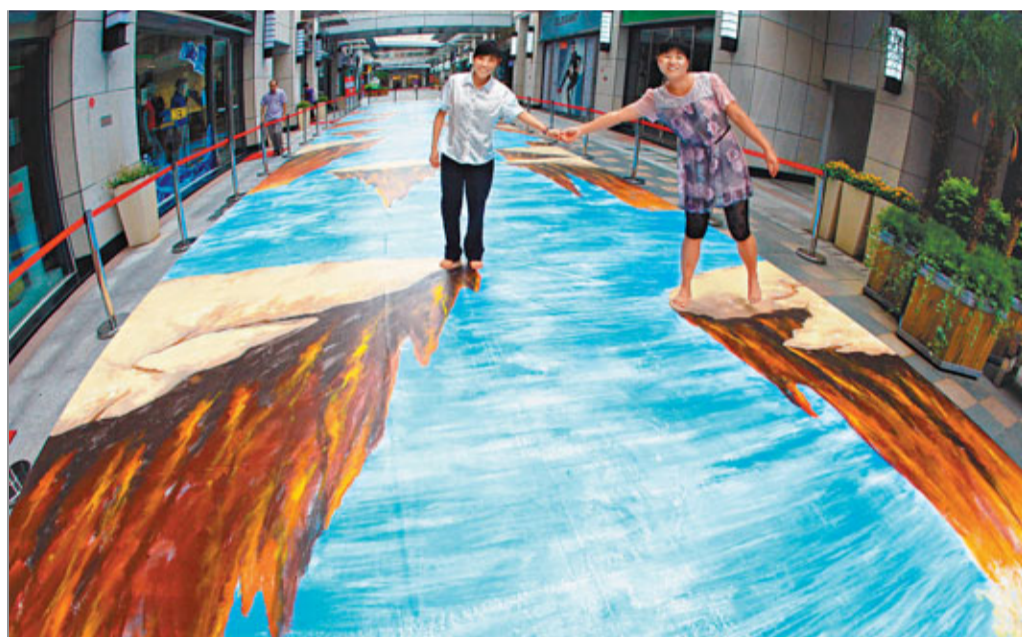
巨幅3D畫亮相福州 近日福州金融街萬達廣場驚現一幅3D畫,該畫長50米、寬5米,視覺效果立體逼真,吸引眾多市民前來參觀拍照。

目前,新橋鎮一方面從有一定專長的優秀民間畫師中挑選、培植文化中心戶,另一方面將當地中學和小學作為美術基地,由各學校成立美術興趣小組,配備專職美術教師,在此基礎上,調動文化個體戶在暑寒假期間舉辦青少年美術、書法培訓班,為當地培養後續人才。