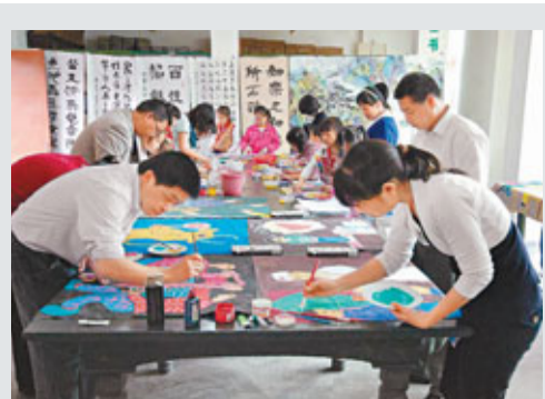
漳平新橋農民的畫作開創了內地諸多第一。

據業內人士披露,明星代言茶企費用不菲,少則百萬元人民幣,多則數百萬,其中「功夫皇帝」李連杰以超過千萬的代言費名列榜首。