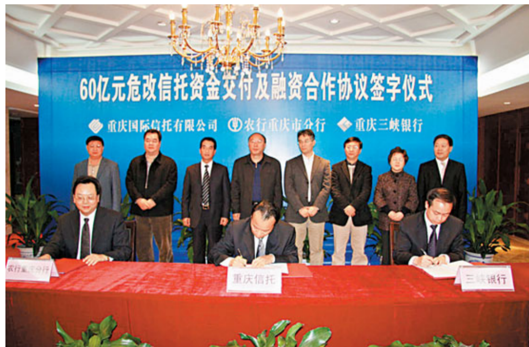
重慶信託融資60億元支持危舊房改造

嘉華嘉陵江大橋工程是重慶市直轄十周年獻禮工程，是重慶新的城市規劃中聯繫重慶市南北主發展軸上的主要紐帶。嘉華大橋主橋橋面寬37米，創亞洲主橋橋面最寬紀錄。2008年，該工程先後榮獲「重慶市巴渝孟孟優質工程獎」和「四川省建設工程天府孟孟獎」，經中國質量協會、全國用戶委員會審定，榮獲「2008年全國用戶滿意建築工程」，同時獲「2008年度中國鐵道工程建設協會火車頭優質工程獎一等獎」及「全國市政工程金盃獎」，受到了社會各界的好評。