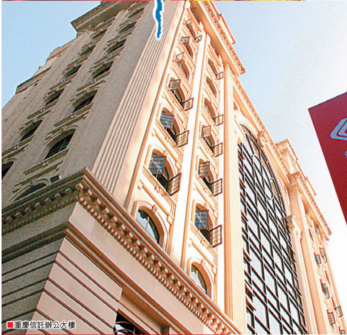
重慶信託辦公大樓

重慶國際信託有限公司作為中國西部最大的信託機構，始終秉承「立足重慶，竭誠服務地方經濟」的宗旨，以民生為導向，突出基礎設施和金融服務兩個重點，充分發揮信託的獨特優勢，大力開展業務創新和產品創新，先後推出創新型信託產品700多個，累計管理信託規模1400多億元人民幣（下同），為「五個重慶」建設募集信託資金300多億元、幫助老百姓增加財產性收入70多億元，取得了突出的成績，連續3年榮獲重慶市「金融貢獻一等獎」、連續4年榮獲「國企突出貢獻獎」，還獲得「市級文明單位」、「最具區域影響力信託公司」、「最具發展潛力信託公司」、「誠信卓越公司獎」等多項榮譽。在自身取得良好發展的同時，也彰顯了企業的社會責任。 ■香港文匯報記者 孟冰