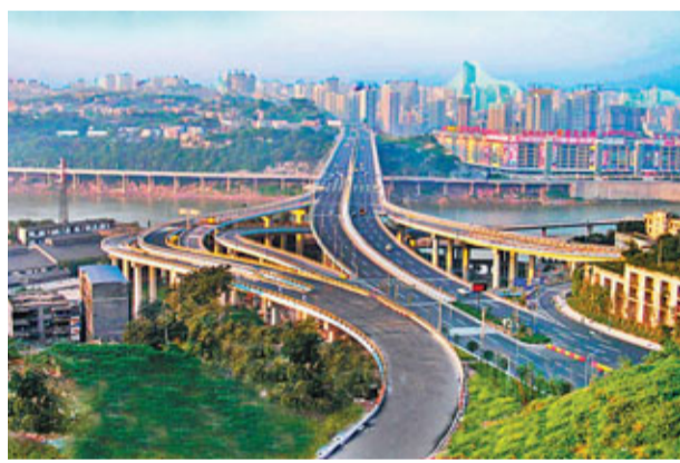
重慶嘉華嘉陵江大橋落成

該資金到位後，不僅用於新建住房，還用於購買重慶存量商品房安置拆遷戶，這一運作可謂一舉三得：一方面為老百姓增加了財產性收益；另一方面助推了城市建設；同時，這筆資金投入到商品房市場，有力地支持了重慶的經濟發展。項目完成後，公司將2500萬元信託管理費悉數捐贈，用於解決重慶貧困職工的實際生活困難，為支持「五個重慶」建設作出了實實在在的貢獻。