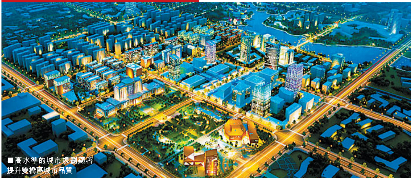
■高水準的城市規劃顯著提升雙橋區城市品質

雙橋的巴岳山麓的負氧離子量為每立方厘米5000個，龍水湖畔的負氧離子量超過每立方厘米4000個，大大高於重慶主城的負氧離子水平，可謂是當之無愧的天然氧吧。