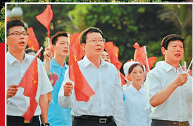
■雙橋區委書記吳國升(中)積極參與群眾文化活動