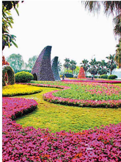
■雙橋正在打造西部首個鮮花港

隨着一系列惠民利民政策出台，雙橋人的幸福感與日俱增。在2010年度重慶市開展的對40個區縣民意調查中，雙橋區幫助失業下崗人員、社會治安情況、城市綠化情況、交通出行情況、看病方便情況等多項指標名列小組第一，總得分位列全市第一。