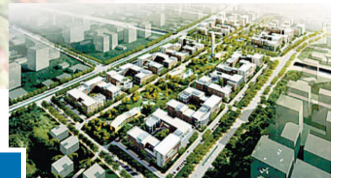
■未來西永微電園將成亞洲最大筆記本電腦生產基地

黃奇帆表示，重大項目是一個地方發展的關鍵性、基礎性項目，只有推進重點項目建設，才能帶動經濟社會更快發展，今年是「十二五」開局之年，重慶將加快推進建設江北嘴、化龍橋、朝天門、悅來、西永五個重點地塊項目，爭取在今年有所突破。黃奇帆將這五個地塊項目比作重慶「五官」，是「長臉」的項目，要想重慶更加「耐看」，就要讓「五官」變得更加端正、漂亮。