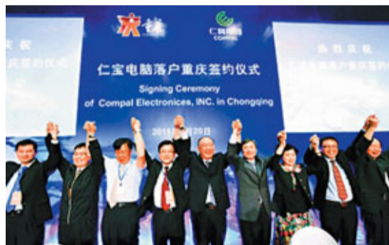
■仁寶電腦在渝落戶，標誌着全球六大電腦代工廠商齊聚重慶。

此外，到2015年，重慶汽車產業會發展400萬輛汽車、1000萬輛摩托車；裝備製造業達到3000億元；化工產業達到3000億元；鋼鐵、有色金屬和各種原材料工業達3000億元左右；加快推動食品、紡織、農產品深加工等各種勞動密集型產業。