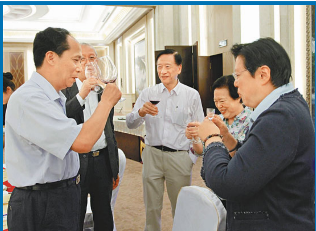
港區全國人大代表團的主席團成員,包括范徐麗泰、袁武、譚惠珠及吳清輝向黑龍江省委書記吉炳軒敬酒致意。

港區全國人大考察團今日會參觀哈爾濱電機廠及哈爾濱工業大學,並前往科技創新城了解當地的創新科技發展。此外,他們亦會前往潤和城安置區,現場視察松北區城鄉統籌建設工作的情况。