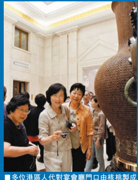
多位港區人代對宴會廳門口由核製裝成的青龍吟春瓶甚感興趣,原來省政府早已準備了一個微型的青龍吟春瓶贈予各代表留念。