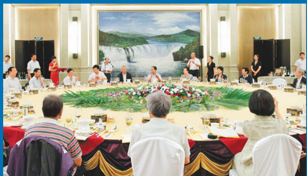
黑龍江省政府宴請港區全國人大代表考察團一行。