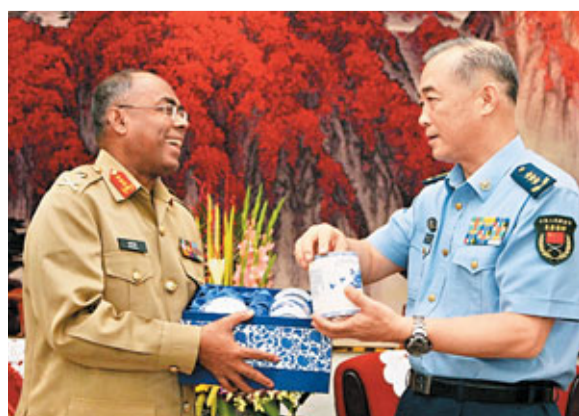
馬曉天空軍上將與瓦希德中將互相贈送禮物。中新社

據中新社19日電 解放軍副總參謀長馬曉天空軍上將19日下午在八一大樓會見了來訪的巴基斯坦陸軍參謀長瓦希德中將一行。馬曉天說, 多年來, 中巴兩國兩軍保持了全天候的傳統友誼, 這符合兩國的根本利益, 為維護地區和平發揮了積極作用。中方願在團組互訪、人員培訓、裝備技術、聯合訓練等方面與巴方開展全方位的友好合作。中方將一如既往地支持巴基斯坦維護國內穩定和發展本國經濟的不懈努力。