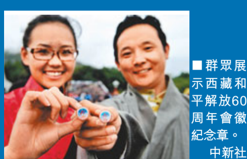
■ 群眾展示西藏和平解放60周年會徽紀念章。