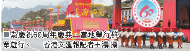
■ 為慶祝60周年慶典，當地舉行群眾遊行。

張慶黎說，當前，西藏已經站在新的歷史起點上，再經過10年奮鬥，西藏將同全國一道建成全面小康社會，到2050年西藏和平解放100周年之際，將與全國一道基本實現現代化。西藏將抓住寶貴機遇，用好全國支援，矢志艱苦奮鬥，推進跨越式發展和長治久安。