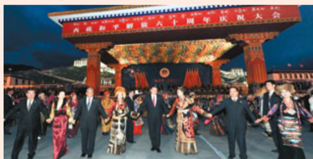
■ 習近平等與拉薩各界群眾一起聯歡。