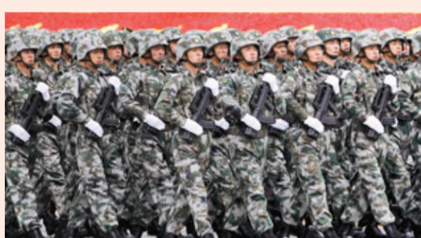
■ 解放軍分列式方陣步入主會場。