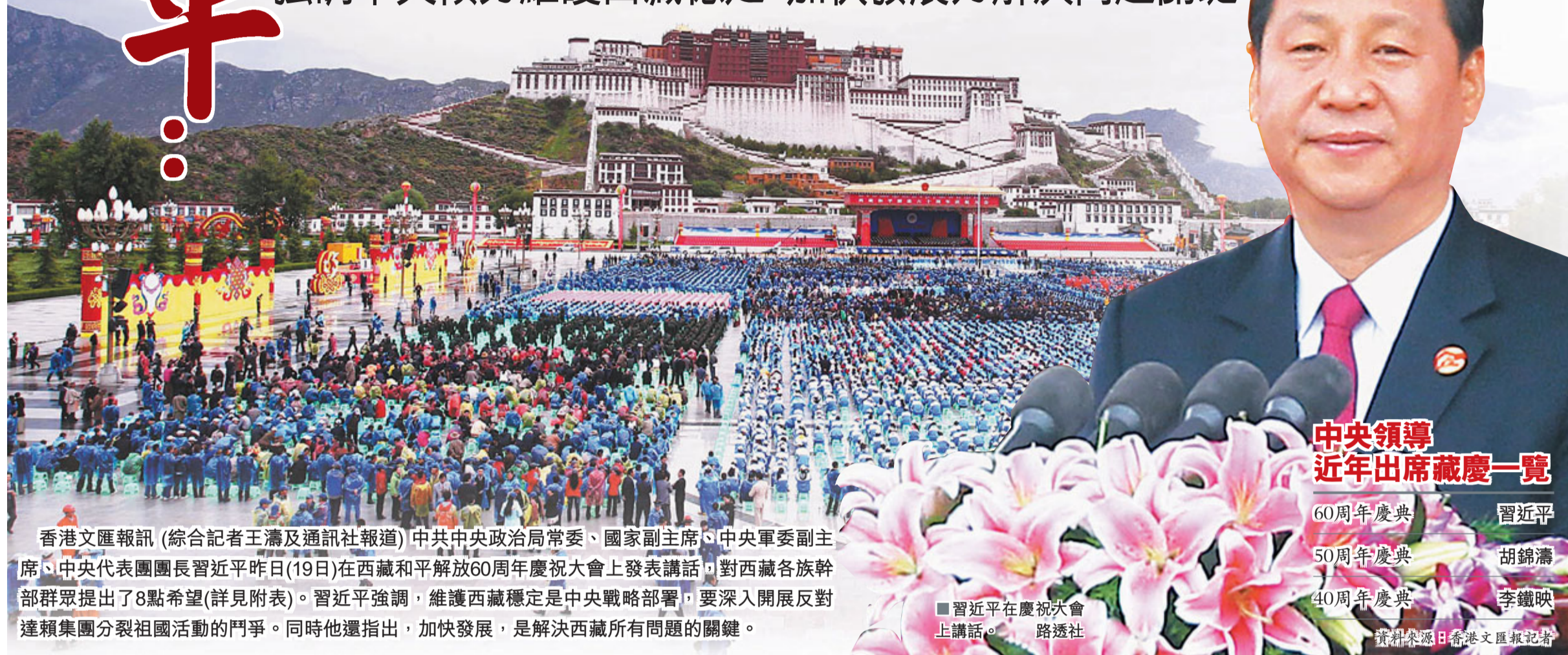
中央領導 近年出席藏慶一覽