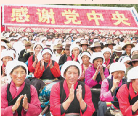
■ 西藏各族各界幹部群眾2萬多人參加慶典。