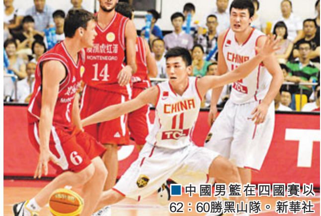
中國男籃在四國賽以62：60勝黑山隊。

香港文匯報訊 (記者 敖敏輝、通訊員 陳建族 廣州報導) 18日，斯坦科維奇盃國際籃球賽組委會與廣州市體育局聯合宣佈，未來5年，國際籃聯官方賽事斯坦科維奇盃國際籃球