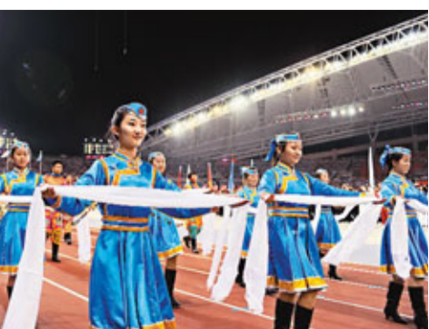
開幕式極具蒙古特色。

香港文匯報訊 (記者 何斌 內蒙古報導) 16日晚，第十一屆全國中學生運動會開幕式在包頭市奧林匹克中心體育場隆重舉行。為期五天的比賽期間，來自全國各省、區、市以及香港特別行政區、澳門特別行政區的34支中學生體育代表團、近3000名運動員將參加田徑、游泳、籃球、排球、足球、乒乓球、武術、健美操、毽球等9個大項目131個小項目的比賽。