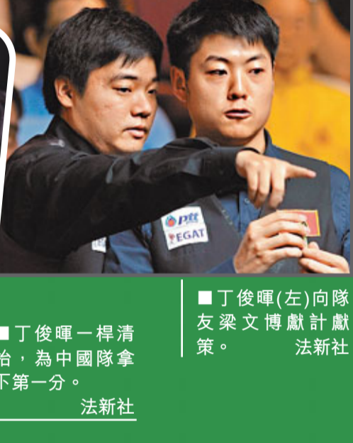
丁俊暉一桿清檯，為中國隊拿下第一分。