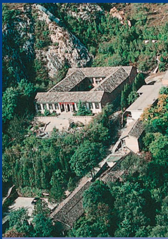
■周口店遺址博物館全景

周口店遺址分遺址區和博物館兩部分，常年向觀眾開放。遺址區有著名的猿人洞、新洞、山頂洞等多個化石地點。博物館包含七個展廳，藏有大量珍貴的文化遺物、動物化石、石器，以圖文並茂的展示形式向觀眾詮釋了周口店遺址的歷史。館內有三維動畫、模擬發掘、動手製作、魔法卡片、幻影成像、磨製骨針、模型裝架等特色科普互動項目。還有弧幕沙盤展示，能夠給觀眾帶來震撼的視覺衝擊。