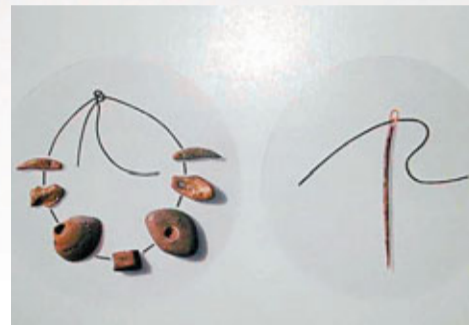
■山頂洞人製作和使用的裝飾品和骨針

第四地點：1927年由步林和李捷發現，1937年進行了發掘，發現了40多種哺乳動物的化石，包括獾、鼯鼠、熊、三門馬、李氏野豬、鹿、葛氏斑鹿等；1973年初，對第4地點進行發掘，發現了較豐富的石製品、用火遺跡和1枚人牙化石，這枚牙齒經研究鑒定為距今約20-10萬年的早期智人的一顆左上前臼齒化石。從第4地點雖然只出土了1枚人牙齒，但從其測量值和形態特