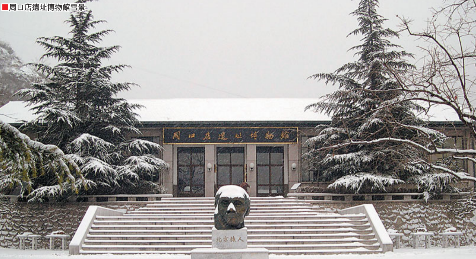
■周口店遺址博物館雪景