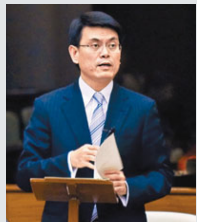
邱騰華表示，當局考慮加強對派發「環保袋」的規管，減少塑料用量。

香港文匯報訊(記者 謝雅實)香港實施膠袋徵費政策2年，不少市民已養成自備購物袋的習慣，令背心袋用量銳減，但俗稱「環保袋」的不織布袋濫發情況加劇。環境局局長邱騰華昨日表示，政策實施後，棄置到堆填區的「環保袋」激增88%。邱騰華強調，根據現行條例，指定零售點若向顧客提供「環保袋」須徵收費用。當局若落實擴大政策至其他零售點，將會諮詢公眾，考慮加強對派發「環保袋」的規管，減少塑料用量。