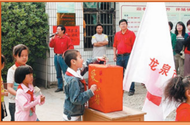
■紅十字會宣揚：「人道、博愛、奉獻」。圖為小學生向需幫助的人們捐款。