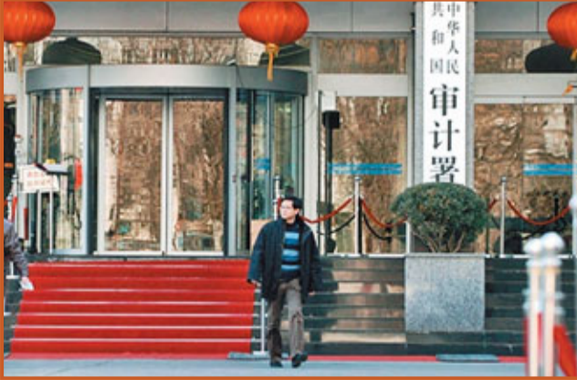
■清正廉潔是紅十字會工作的生命線。目前國家審計署工作組已進駐商紅會進行審計。圖為國家審計署。

為了重塑紅十字會的信譽和形象，近期紅十字會醞釀了多個制度性監管舉措。中國紅十字會秘書長王汝鵬透露，紅十字總會今年醞釀成立社會監督委員會，將自律和他律結合起來。此外，王汝鵬4日曾表示，力爭紅十字會捐款查詢平台7月上線。