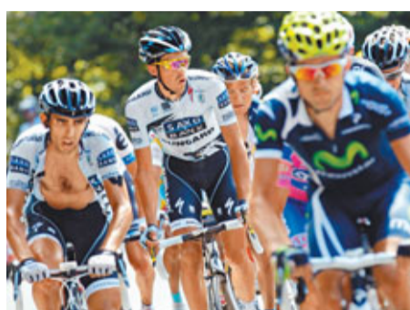
衛冕的西班牙名將干達杜(中)在總排名上列第七。

2011年環法單車賽已經結束了14個賽段的比賽。衛冕冠軍、西班牙名將干達杜在總排名上僅名列第七。對於接下來的比賽，這位28歲的環法老將表示，他希望在阿爾卑斯山脈的賽段中追回差距。