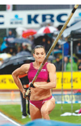
伊辛巴耶娃贏得賽季首勝。

耶娃曾經蟬聯了2004雅典和2008北京兩屆奧運會的撐桿跳冠軍，並且把該項目的世界紀錄突破5米。然而，她不可戰勝的紀錄卻在近兩年接連被打破，除了09年世錦賽的失手外，她在2010年多哈舉行的世界室內田徑錦標賽中也僅僅收穫第四名。 ■綜合外電