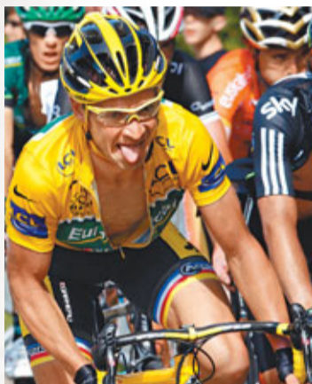
法國車手沃克勒繼續排名首位，繼續穿黃色戰衣。路透社

在總排名上，法國車手沃克勒繼續排名首位。衛冕冠軍、西班牙名將干達杜位列第七。 ■新華社