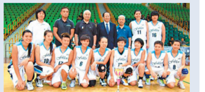
籃總副會長貝鈞奇(後排右四)主持頒獎禮。

福建女子籃球隊在修頓室內場館以75:57擊敗南華，奪得香港籃球聯會女子甲組總冠軍，由籃總副會長貝鈞奇主持頒獎禮。