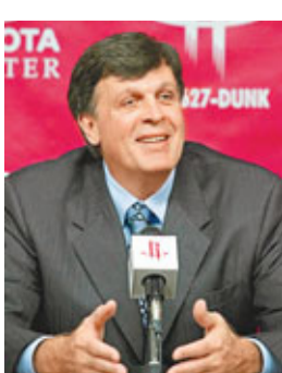
休斯敦火箭隊新任主教練麥克黑爾(見圖)確定了其教練班子成員，前公牛隊助理教練桑普森等4人被任命為助理教練。