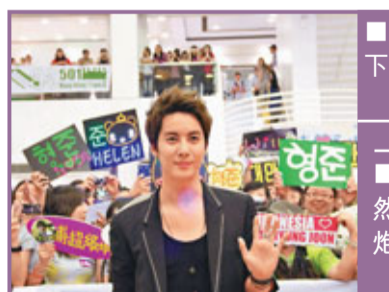
金亨俊與台下粉絲合照。

香港文匯報訊 (記者 陳敏娜) 韓國組合SS501成員金亨俊前晚在大埔超級城舉行簽名會，獲800名粉絲捧場。他表示雖然今次是第3度訪港，但港迷仍然很熱情，又謂如果有假期，都想來香港度假，還想試玩笨豬跳。他指將會在10月推出新碟，風格跟上一張完全不同，以舞曲為主，亦想嘗試拍劇，演跟自己性格相似的角色，表現出他開朗、可愛及溫柔的一面，又笑說拍古裝劇都沒問題。問及是否以日本為發展中心，金亨俊搖頭說不，韓國及日本各佔一半。