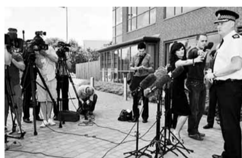
英國警方高層稱污染鹽水事件嚴重，承諾盡快緝兇。