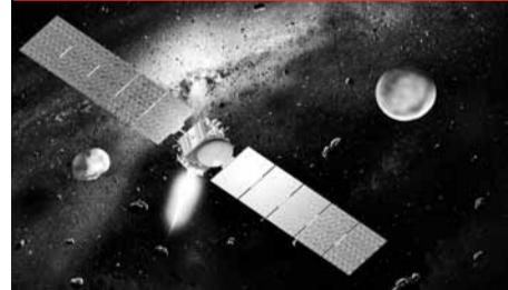
「曙光」號探測船接近「灶神星」的想像圖。

經過4年太空旅程，美國太空總署(NASA)科學探測船「曙光」號(Dawn)取得重大突破，前日正式進入太陽系小行星帶第2大小行星「灶神星」(Vesta)軌道。「曙光」號進行1年探索任務後，將再啟程前往另一矮行星「穀神星」(Ceres)探索，NASA冀比較兩個星體，解開太陽系遠古歷史之謎。