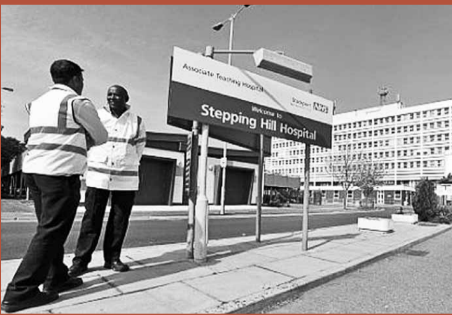
英國的斯泰平山醫院爆發鹽水受胰島素污染事件。