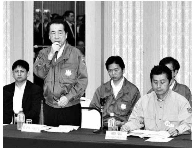
菅直人在關於震後重建會議上發言。

被指處理地震善後及核危機不力的日本首相菅直人，面臨強烈下台壓力，外界雖然預料他在下月辭職，但據報他近日已開始準備出席9月下旬的聯合國大會，多日來更對朝野要求下台的呼聲，表現「極度無視」的態度。種種跡象均顯示，菅直人毫無下台之意。