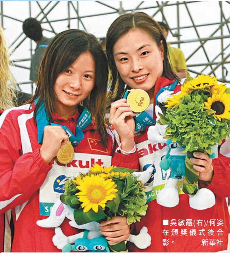
■吳敏霞(右)/何姿在頒獎儀式後合影。 新華社

香港文匯報訊（記者 章蘿蘭 上海報道）2011年上海游泳世錦賽16日在東方體育中心跳水館「月亮灣」正式揭幕，中國組合吳敏霞/何姿在女子雙人3米板項目上發揮出色，毫無懸念勇奪賽會首金。這也是自2001年以來，中國隊連續第六次問鼎世錦賽女子雙人3米板冠軍獎盃。