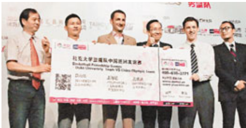
■杜克大學隊日前在上海召開新聞發佈會。香港文匯報上海傳真

美國體育頻道ESPN評出美國十大籃球名校，杜克力壓北卡大學、堪薩斯大學，以絕對優勢排名第一，是當之無愧的籃球第一名校，曾四次在NCAA中奪得冠軍。此番，杜克大學來華還將帶來校友、NBA球員格蘭希爾、積遜威廉士。而在剛剛結束的2011年NBA選秀大會中眾望所歸的狀態秀歐文、新秀諾蘭史密斯也有可能隨隊來到中