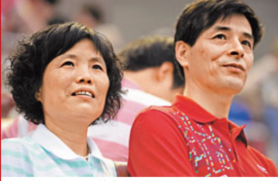
■吳敏霞的父母前來觀戰。