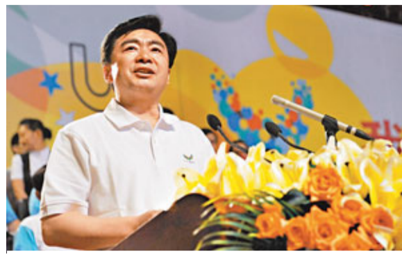
■深圳市委書記王榮說,深圳要節儉辦大運。圖為他日前在深圳大運會倒計時30天活動上發言。資料圖片自願向交警部門申請、申報主動停用、少用機動車的時間。王榮認為,將選擇權交給市民,讓市民能夠選擇最適合自己的參與「綠色出行」的時間和方式,遠比政府不斷發布通告的強制管理方式更為理性、更為有效和民主。

在大運會倒計時30天活動上,王榮曾提出「綠色出行」倡議,一改大型賽事或活動舉行時採取按單雙號限行的臨時性交通管理政策,希望車主們在大運期間