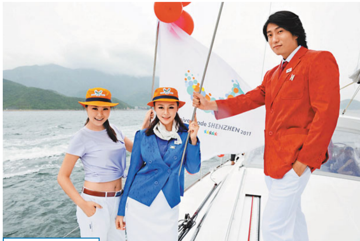
大運會VIP官員服裝 16日,深圳大運會VIP官員服裝獨家供應商組織海上大運服裝展示,在海上傳遞大運精神。

他承認,在實施非常規管理辦法和政策舉措的時候,應該要做到少擾民、不擾民。如何爭取市民的理解和參與,確實有方式方法問題,也有對工作的程度把握問題。對於外界的議論、批評,王榮表示深圳會一直關注社會、媒體、市民的建議、批評,並虛心地接受,把它作為改進工作、完善工作一個重要的推動力。