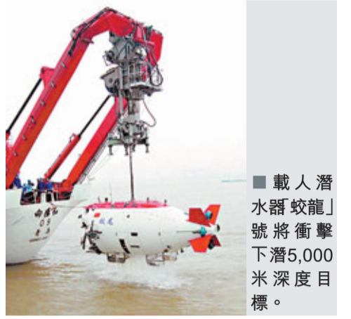
■載人潛水器「蛟龍」號將衝擊下潛5,000米深度目標。

據新華社北京16日電 經過16天航行,搭載中國「蛟龍」號載人潛水器的「向陽紅09」船於北京時間16日下午2點抵達東北太平洋海試區域,「蛟龍」號將在這裡衝擊下潛5,000米深度目標。