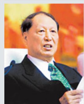
香港文匯報訊(記者 章韜 上海報導)全國人大常委會原副委員長成思危(見圖)16日在2011復旦管理學國際論壇上獻計中國公共管理,指出未來10年的中國公共管理需處理好四大關係——法制和制度、效率和公平、政府和市場以及集權和分權,並指中國的公共管理一定要和改革開放緊密結合。

他表示,中國公共管理首先要處理好法制和制度的關係,要實施依法治國,但首先要依法治官,依法行政,要求官員守法、講理。他舉例說:「經常有人反映說,市長、書記原來答應什麼,結果前任一調走,後任就不認帳了,那人家在你那的投資就不能進行了,所以守法講理很重要。」