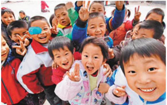
■北京將建立以水控制居住人口規模的制度。圖為在京上學的農民工子弟。

據新華社北京16日電 北京市水務改革發展工作大會前日召開,市委書記劉淇提出,北京將落實最嚴格的水資源管理制度,建立起以水控制居住人口規模的制度。