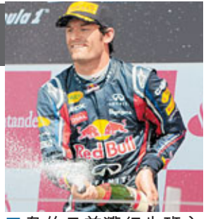
■韋伯日前獲紅牛班主力撐。資料圖片

顛倒我的世界。」韋伯在英國站不滿車隊要求自己不可超越隊友維泰爾而抗令，對此他繼續透露後已與領隊漢拿傾談過：「賽後漢拿與我就此事談過，我認為大家均有從對方角度看。當時我被矛盾的情緒打擊，不論誰在前面，也希望可改善自己的位置，尤其是面對像維泰爾這種水平的車手，更需要努力去趕上。」