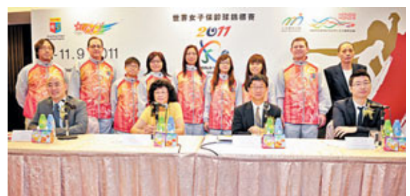
■香港保齡球總會昨宣布女子世錦賽詳情。

香港文匯報訊 世界女子保齡球錦標賽9月將首次落戶香港，賽事共吸引來自美國、亞洲區和歐洲區的37個國家和地區約200名選手，出戰單人賽、雙人賽、三人隊際賽、五人隊際賽、四項全能及優秀賽。