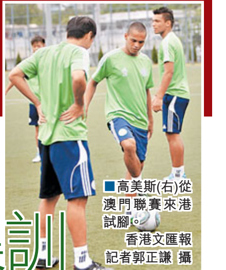
■高美斯(右)從澳門聯賽來港試腳。香港文匯報記者郭正謙攝

湖人球星高比拜仁昨日抵達瀋陽進行籃球訓練營活動，親自向小球員傳授籃球技術。今日拜仁將轉赴長沙，指導青少年球員訓練，並將在球迷見面會上大顯球技。新華社