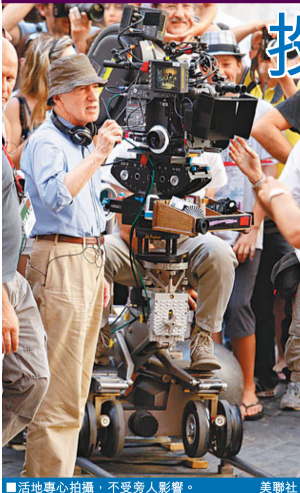
■ 活地專心拍攝，不受旁人影響。

荷里活名導演活地亞倫 (Woody Allen) 目前正在羅馬拍攝其歐洲三部曲的最終章《The Bop Decameron》。據悉他借該片，把自己喜愛羅馬的心情帶給觀眾，而其歐洲三部曲的第二章《情迷午夜巴黎》亦成其導演生涯中最賣座的電影。