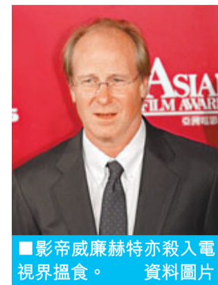
■ 影帝威廉赫特亦殺入電視界盞盞。

美國時間7月14日，第63屆艾美獎公布提名名單，由奧斯卡影后琦溫斯莉 (Kate Winslet) 主演的迷你劇《慾海情魔》獲得21項提名，領先其他劇集，琦溫更有份角逐迷你劇/電視電影類最佳女主角。而奧斯卡影帝威廉赫特 (William Hurt) 亦憑《Too Big to Fail》入圍迷你劇/電視電影類最佳男主角。