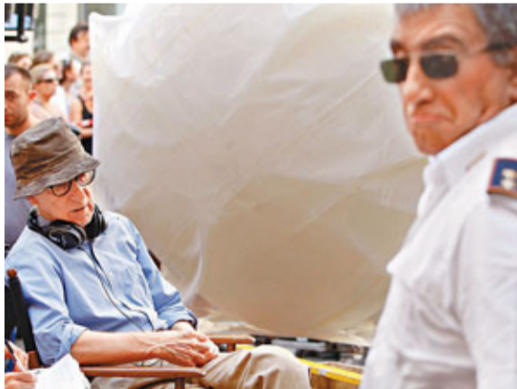
■ 活地拍片時，當地警察幫忙維持秩序。