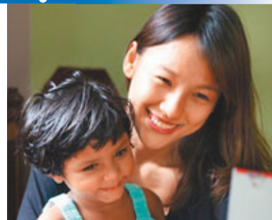
■ 李孝利與助養的女童度過快樂的時光。

韓國天后李孝利的廣告照近日突然在網上流傳，照片中她大地媚眼，電力十足，美麗的妝容和微曲的長髮，加上與其古銅色肌膚相襯的黑色禮服，更添無窮氣質，讓網友心動不已，紛紛留言大讚她是天生的藝人，能同時演繹純潔、清純、性感、冷傲和可愛等多種魅力。日前，她與韓流天王Rain透過Twitter互相加油，卻遭網友留下「別挑逗Rain，他適合比較文靜的淑女」的言論，她不但沒有發怒，還禮貌地回帖說：「我是淑女！」，並上傳了一張趣怪婚紗照，強調她是一名淑女。此外，本月初她曾赴印度進行探訪親善之旅，不但與小孩子們一起玩遊戲，還親手分飯給他們，亦成功與其助養的4歲女童會見。 ■文：實習記者 陳湘靜