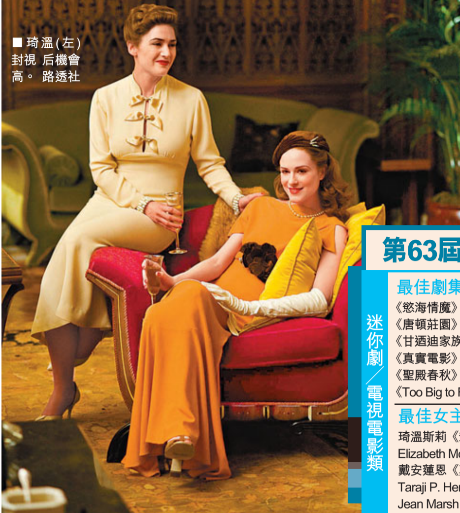
■ 琦溫 (左) 封視 後機會高。

琦溫主演的《慾海情魔》改編自美國作家詹姆斯凱因 (James M. Cain) 在1941年創作的同名小說，講述20年代一名美國單親媽媽Mildred Pierce從餐廳女侍應成為餐飲業女強人的故事，期間還穿插了她與女兒及情人間的愛恨糾葛。琦溫飾演女主角Mildred，不溫不火的演技，令她順利入圍爭取視后，《樓上樓下》的Jean Marsh及《唐頓莊園》的Elizabeth McGovern將是其最