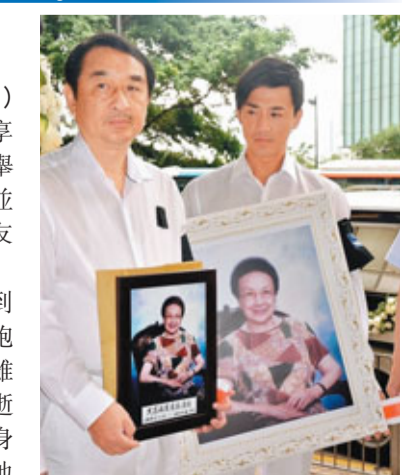
■林峯和父親捧着祖母遺像，送別祖母最後一程。

香港文匯報訊（記者 黃佩麗）林峯祖母黃達治早前因病逝世，享年95歲，昨日在北角香港殯儀館舉殯，喪禮採佛教儀式進行，林家並安排數名僧侶到場誦經，過百親友到場致哀。