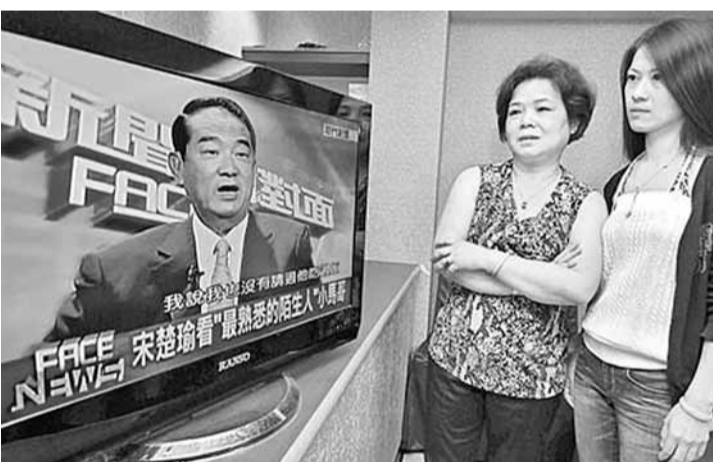
宋楚瑜日前在論政節目亮鏡，不住批評與國民黨互信。網上圖片

對於宋楚瑜的重話，國民黨發言人賴素如15日表示，國民黨將以最大的誠意加強與宋及親民黨的溝通，並呼籲兩黨攜手為台灣打拚，不負泛藍支持者期盼。